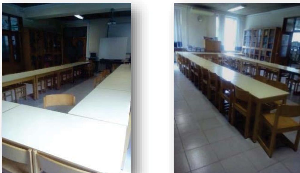
Figura 3. Disposição da sala em 'U'