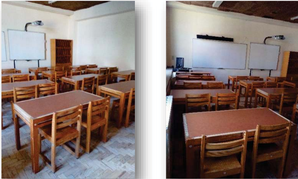
Figura 1. Disposição da sala em fila