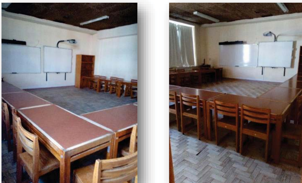
Figura 2. Disposição da sala em 'U'