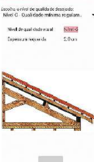
Figura 8: Opção nº 6 da aplicação móvel (1)

Introduza o nível de qualidade que pretende, sendo indicada a espessura de revestimento de cortiça requerida para tal: