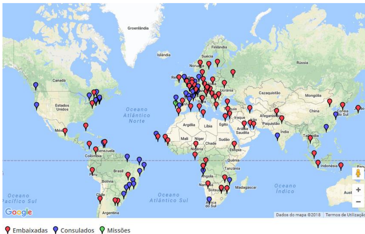
Figura 1: Mapa da rede diplomática