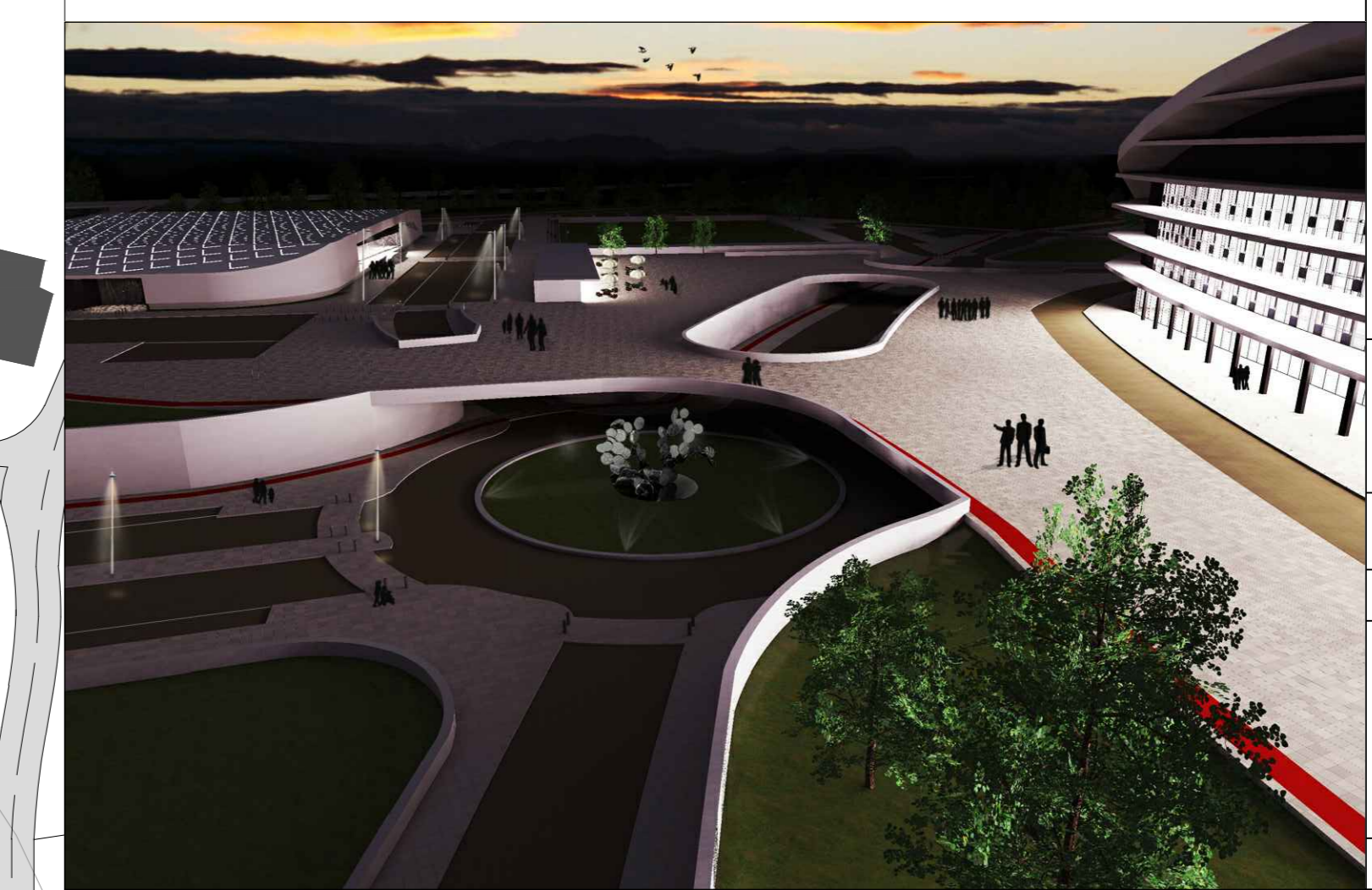
-Vista Norte da proposta