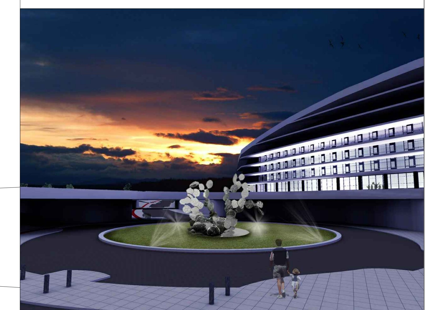
-Vista dos acessos ao pavilhão multiútilos