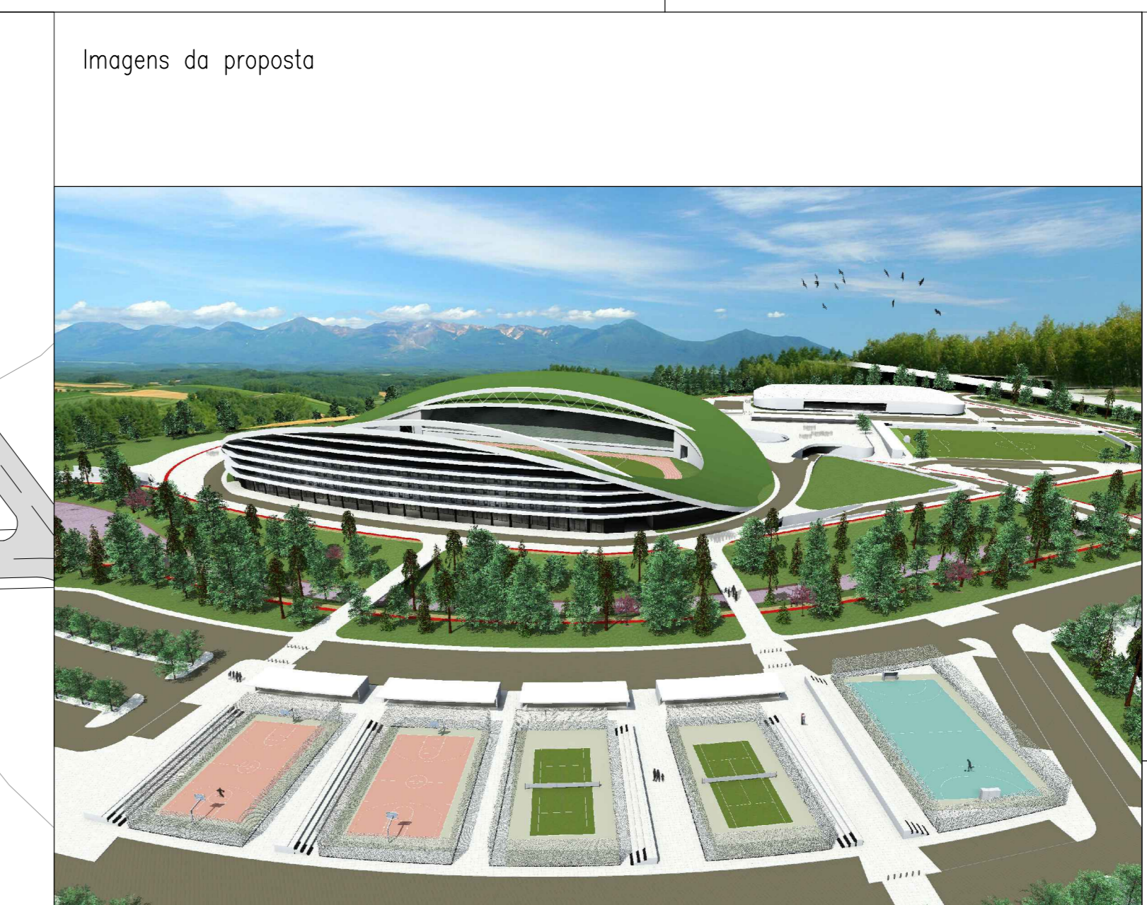
Imagens da proposta