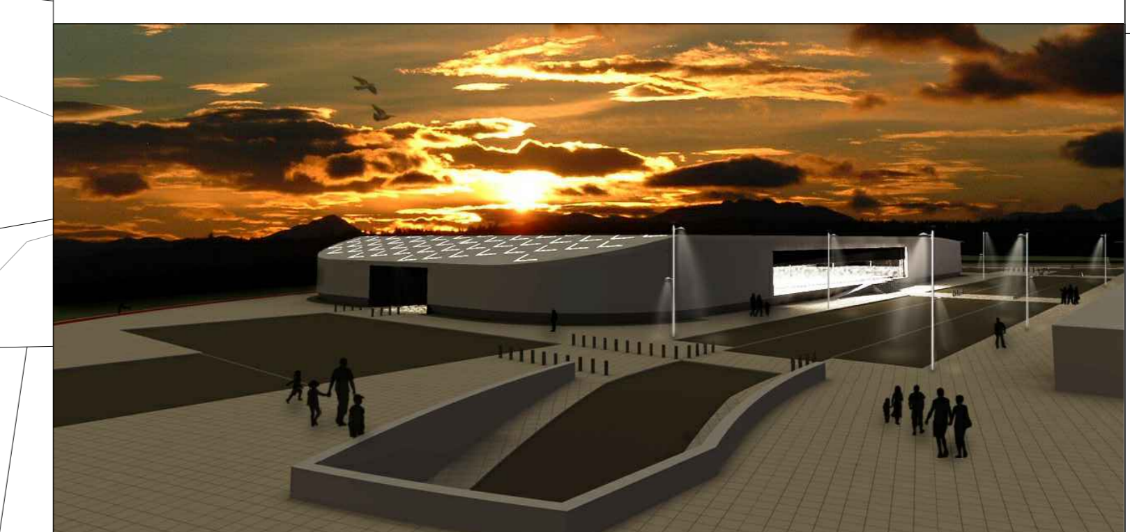
-Vista geral da proposta