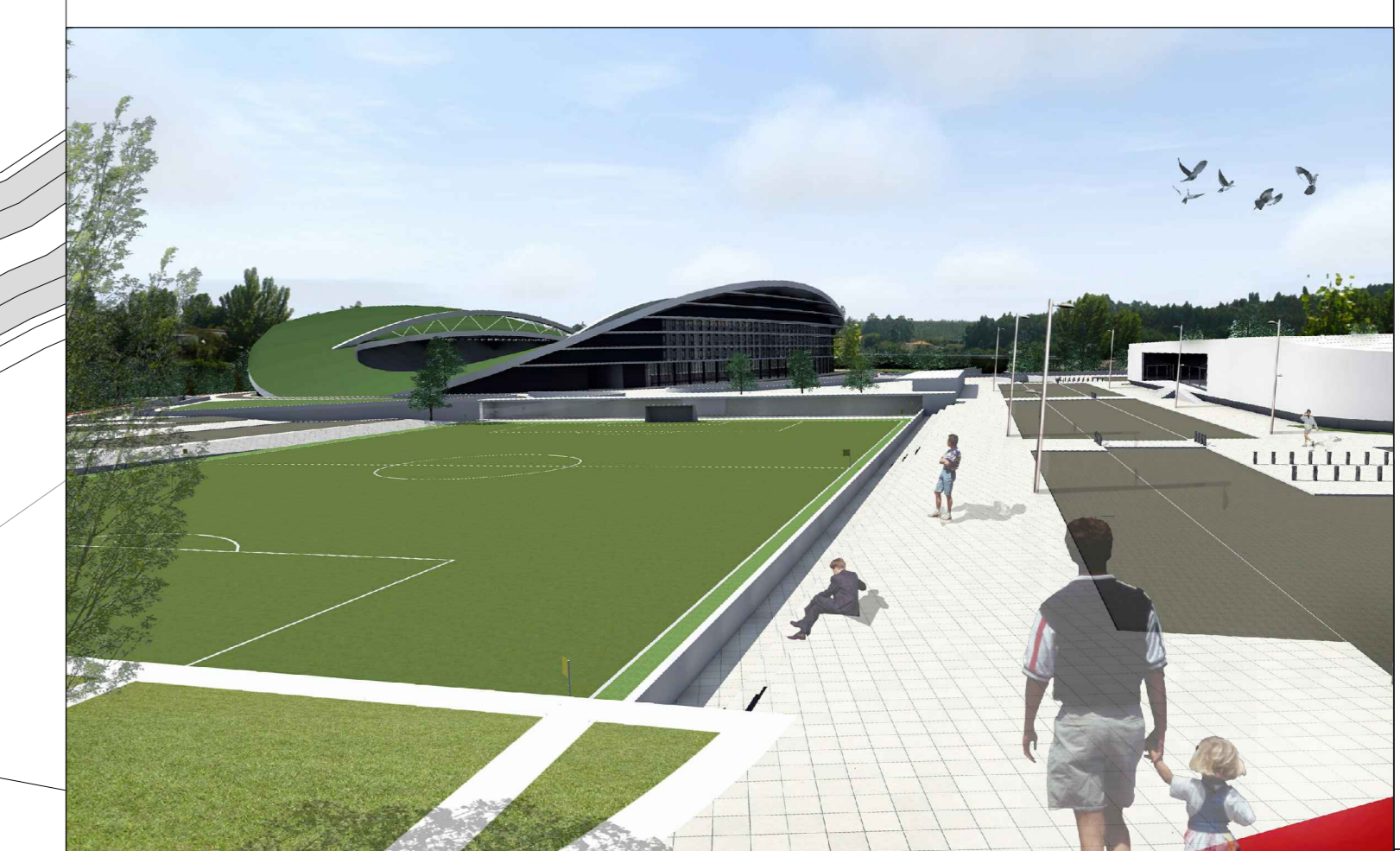
-Vista do principal acesso à Cidade Desportiva