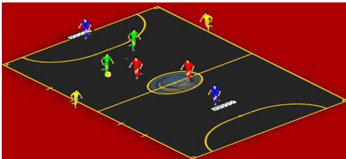
Figura 3 - Exercício Nível Elementar