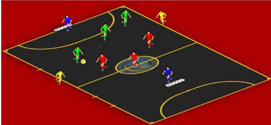
Figura 4 - Exercício Nível Intermédio