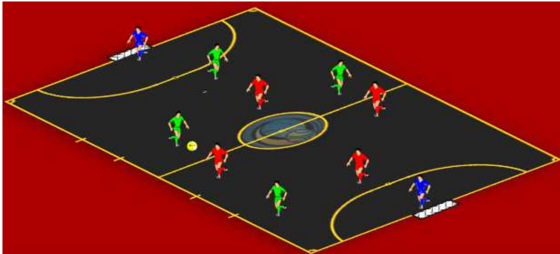
Figura 5 - Exercício Nível Especialização