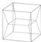
Figura 1 23

com a configuração da figura abaixo (tracejado), porque tal configuração é aquela que minimiza a área de superfície das películas de sabão.