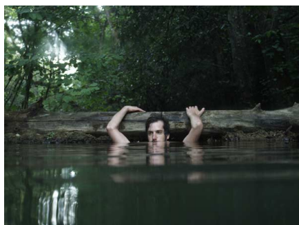
Tots Els Camins de Déu, de Gemma Ferraté