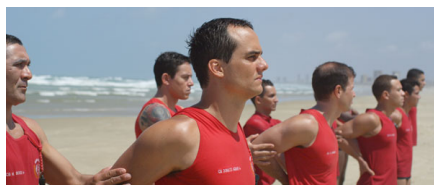
Praia do Futuro, de Karim Ainôuz