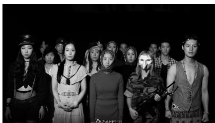
Cancelled Faces, de Lior Shamriz