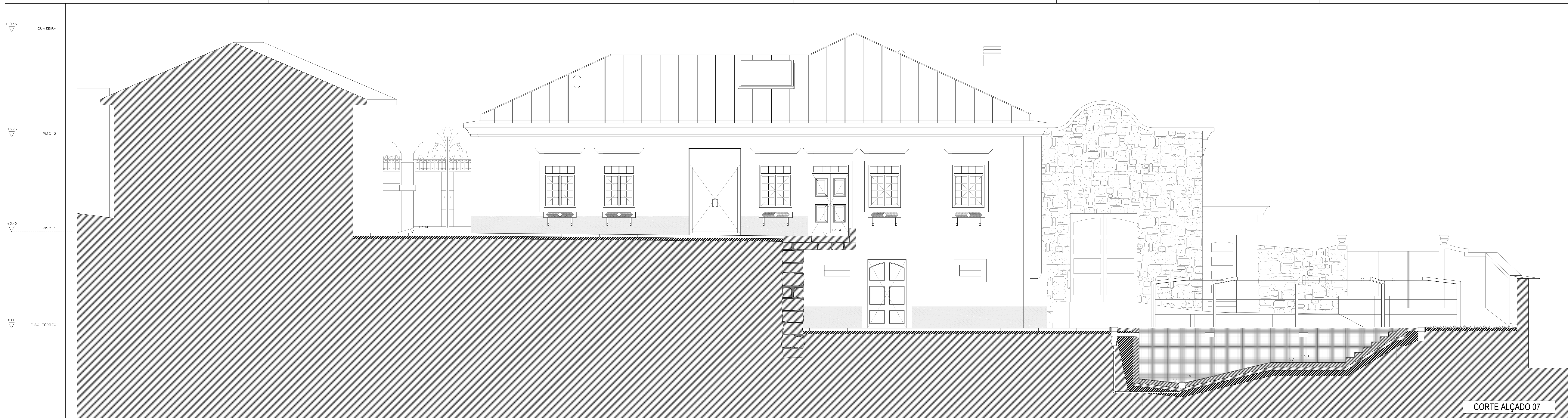
CORTE ALÇADO 07