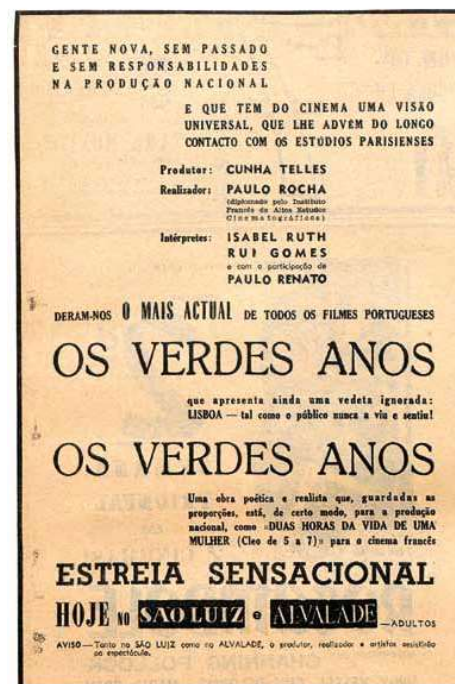
Anúncio ao filme Os Verdes Anos , in Diário de Lisboa – Lisboa. A. 43, n.º 14 712 (28 nov. 1963), p. 3. BNP: J. 4349 M.