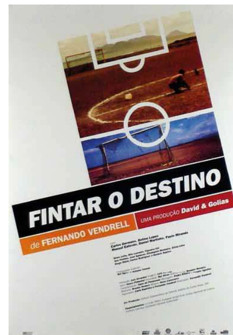
Cartaz do filme Fintar o Destino (1997), Fernando Vendrell.

A fortalecer a aposta na linha “europeia”, em 1989 eram assinados acordos de cooperação com a Espanha e a Alemanha, ainda em vigor, mas seria a França o alfa e o ómega do cinema português nas décadas seguintes. A influência francesa foi tal que, em meados dos anos 80, perante um crucial impasse nas políticas públicas de apoio à produção cinematográfica, o então Ministério da Cultura e da Coordenação Científica, titulado por Francisco Lucas Pires, resumiria as duas principais tendências com uma expressão fortemente estigmatizada que ficaria célebre: “a infeliz metáfora dos ‘filmes para Bragança ou