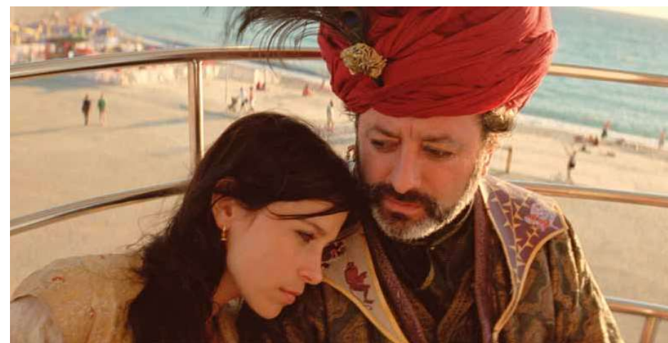
As Mil e Uma Noites – Arabian Nights (2015), Miguel Gomes.

Al longo da sua história, o cinema português foi conhecendo vários projetos que alteravam