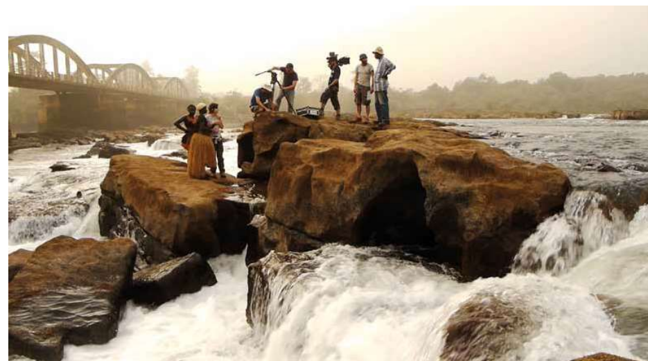
Rodagem do filme Kacjike (2014), Sana N'hadá.

O desejo de internacionalização nasceu com o próprio cinema português. Desde Aurélio da Paz dos Reis, o “pai” do cinema português, a internacionalização tem sido uma vontade, uma ambição ou uma necessidade para o cinema português, tanto para a sua expansão como para a sua sobrevivência. O objetivo deste breve texto é fazer uma panorâmica retrospectiva sobre as principais estratégias de internacionalização tentadas ao longo da história do cinema português, propondo