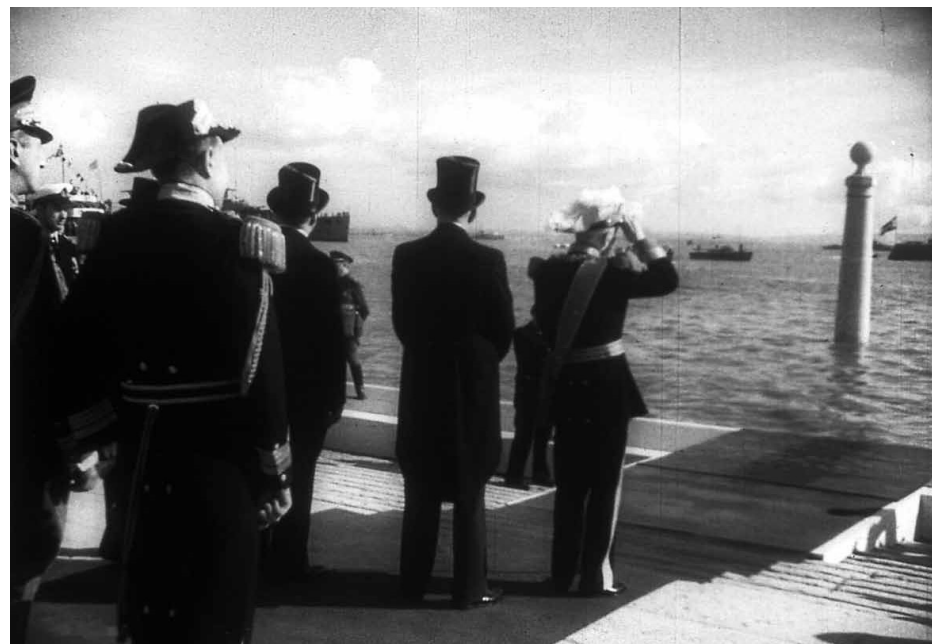
Jornal Português n.º 86, novembro de 1949.