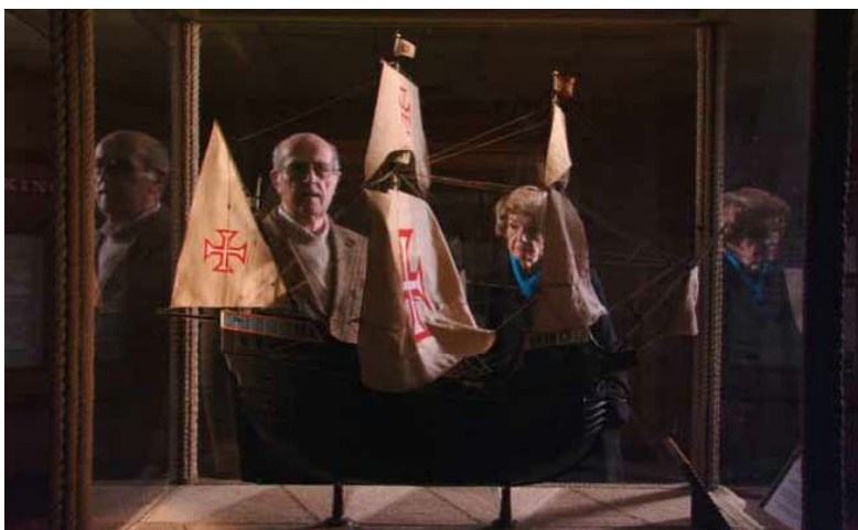
Cristóvão Colombo – O Enigma (2007), Manoel de Oliveira.

Progressivamente, a nova geração de cineastas passou a ter outro público de referência