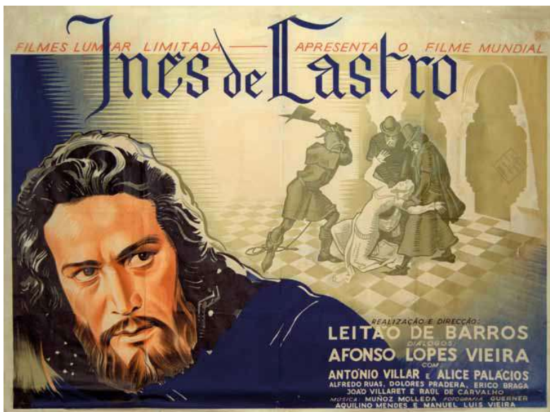
Cartaz do filme Inês de Castro (1945), Leitão de Barros.