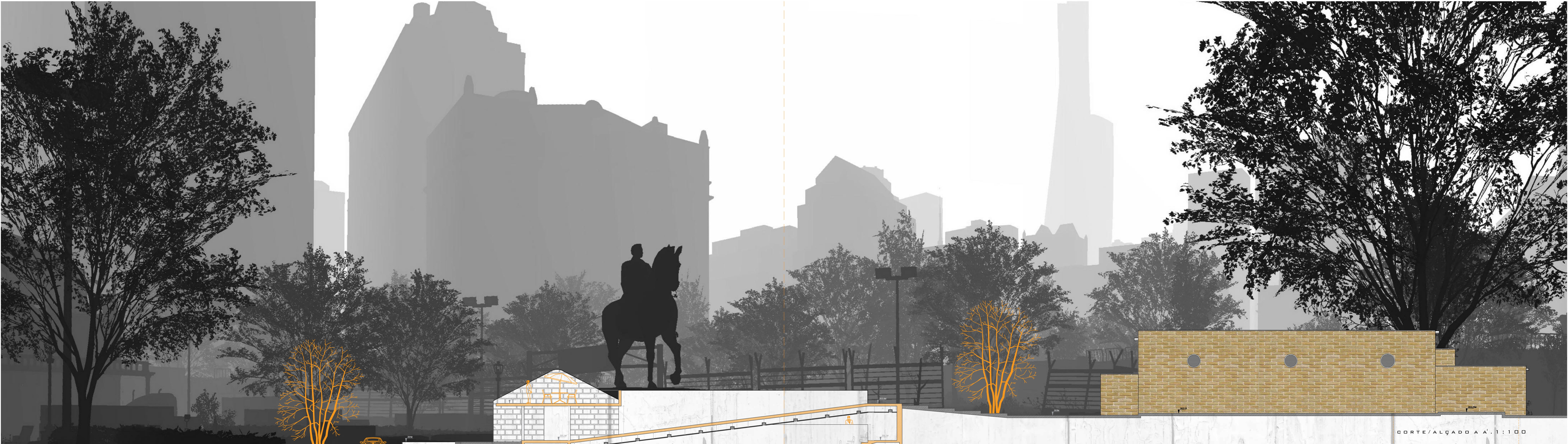
CORTE/ALÇADO A A' 1:100

NÃO OBSTANTE, ESTE É UM ESPAÇO COM UM ENORME POTENCIAL NA CIDADE, DEVIDO À SUA LOCALIZAÇÃO CENTRAL E ÀS SUAS IMPORTANTES FUNÇÕES NO CONTEXTO URBANO. NUMA PERSPECTIVA DE FUTURO E DE DESENVOLVIMENTO URBANÍSTICO, ESTE PROJETO PRETENDE, ATRAVÉS DE UMA NOVA PROPOSTA DE PROGRAMA E DE UMA REQUALIFICAÇÃO DOS EDIFÍCIOS EXISTENTES E RESPECTIVO ESPAÇO EXTERIOR, PROMOVER E POTENCIAR O DESENVOLVIMENTO E O CRESCIMENTO DE NOVAS EMPRESAS (START-UPS, SPIN-OFFS), BEM COMO DE PARCEIROS DE NEGÓCIOS, ATRAVÉS DE UM AMBIENTE DE CO-WORKING. PARALELAMENTE, PRETENDE-SE AGREGAR À ESCOLA PROFISSIONAL E O CENTRO EDUCATIVO JÁ EXISTENTES ATRAVÉS DE UMA ESTRATÉGIA PROGRAMÁTICA CONJUNTA. NO SEU CONJUNTO, CONSIDERA-SE QUE ESTA PROPOSTA PODE TRADUZIR-SE EM VÁRIOS BENEFÍCIOS: O CRESCIMENTO DE UMA COMUNIDADE EMPREENDEDORA E REVITALIZAÇÃO DA COMUNIDADE JÁ EXISTENTE, POTENCIADOS ATRAVÉS DE NOVOS ESPAÇOS DE INOVAÇÃO QUE ALIEM A COMPONENTE DE EDUCAÇÃO AO EMPREENDEDORISMO.