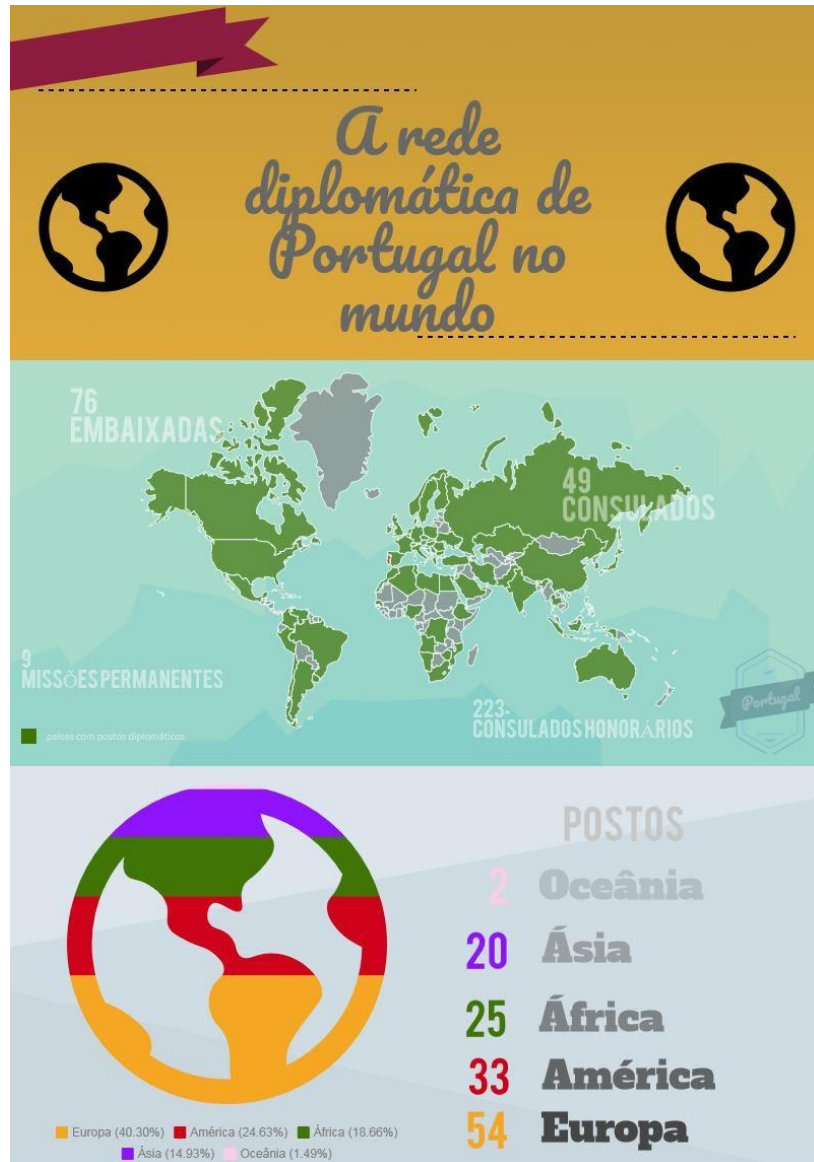
Figura 1: A rede diplomática de Portugal no mundo