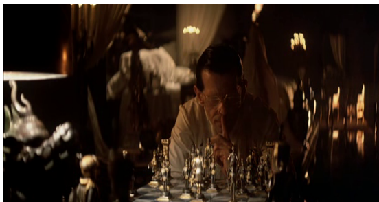
Fig. 7 - Blade Runner