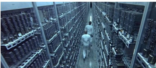
Fig. 3 - THX 1138