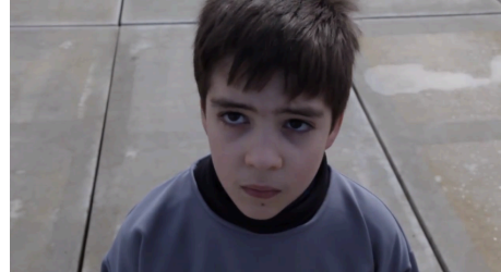
Fig. 9 - A Invenção do Amor

No que toca ao uso de câmara à mão, a escolha dos momentos esteve intrinsecamente ligado à carga dramática de cada cena, bem como às características de cada um dos universos retratados. A preocupação pela ordem levaram à escolha de planos fixos ou com suaves movimentações de câmara para filmar as cenas em que o Governo está presente. No entanto, assim que o descontrolo do Governo perante as atividades da Resistência começa a surgir, é usada câmara à mão nos momentos que retratam maior tensão entre as personagens, bem como em momentos de maior ação. São exemplos a cena da discussão entre o Coronel e os três soldados, após o caso de contágio na escola, bem como a cena em que o Soldado 3 é preso, após enviar um email para a Resistência. Esta escolha em mudar a presença da câmara prende-se com a necessidade em acompanhar a mudança de comportamento das próprias personagens e a forma como estas lidam com a falta de controlo com que se veem. As oscilações da câmara são mais acentuadas em momentos de maior tensão ou ação, como é o caso da discussão do Coronel com os três soldados após o caso de contágio na escola; o momento em que o Soldado 3 é preso; ou a cena em que os soldados invadem o edifício onde a Resistência está escondida.