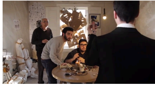
Fig. 6 - A Invenção do Amor