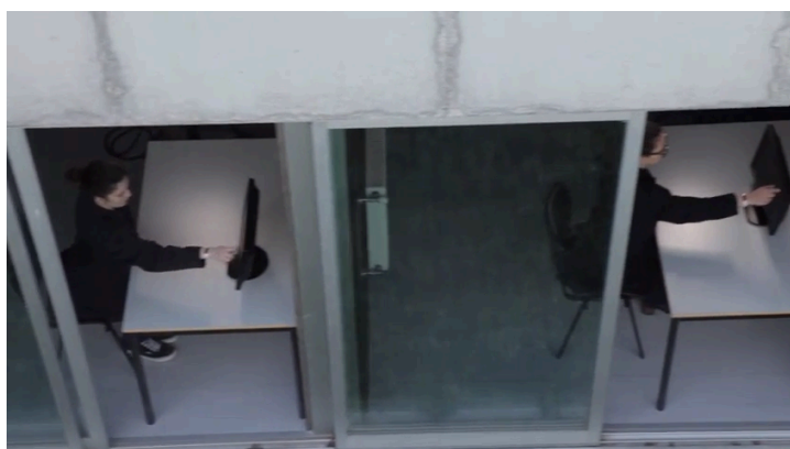
Fig. 12 - A Invenção do Amor

Por sua vez, THX 1138 (George Lucas, 1971) serve de crítica à desumanização e à forma como as pessoas são vistas como uma espécie de produto, definidas por um nome e um prefixo. No filme de ficção científica de George Lucas existe uma massificação das pessoas, sendo que se vestem da mesma forma e usam o mesmo corte de cabelo, e o Estado é apresentado como o opressor que controla as pessoas ao extremo. Esta ambiência foi