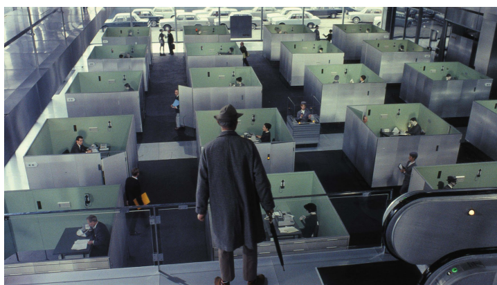
Fig.11 - Playtime

cidade é apresentada e a forma como a arquitectura se destaca, através do uso de espaços rectilínios e minimalistas. A cena, em Playtime, em que Mr. Hulot observa a forma como um grupo de trabalhadores executa as suas funções, em pequenos cubículos fechados e padronizados, evitando qualquer contacto entre si, serviu de inspiração neste projeto para a cena em que 3 mulheres, de forma coordenada, trabalham também em seu cubículo. A forma como Playtime dá importância à multidão e à não individualização foi também objeto de preocupação na criação do ambiente correto para este projeto.