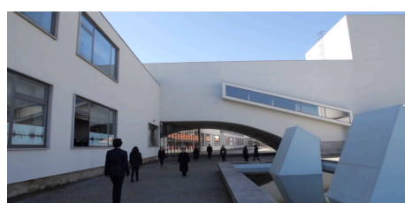
Fig. 4 - A Invenção do Amor

Por outro lado, existe um avesso desta história em termos de identidade e aspeto, existindo a possibilidade de diferenciar entre os espaços anteriormente referidos e outros espaços que são habitados pela resistência. Aqui, em antagonismo com a pretensão do aspeto referido anteriormente, o que se pretende é uma humanização dos espaços através do uso da cor e da temperatura da luz. São espaços onde se sente uma presença mais humana, onde há um calor e uma sensibilidade que não se sentem nos espaços opostos em termos de personagens, narrativa e aspeto plástico. O uso de diferenças cromáticas nas luzes e nos fundos, aliados à plasticidade de film noir , sempre em conjunto com uma variação de baixa e elevada intensidade das mesmas, revela todo um carácter humano, mas mais sóbrio e sombrio, muito de clandestinidade, tanto dos espaços em si como dos próprios personagens que os habitam.