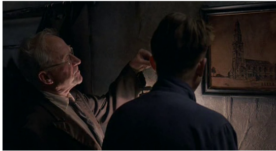
Fig. 5 - 1984