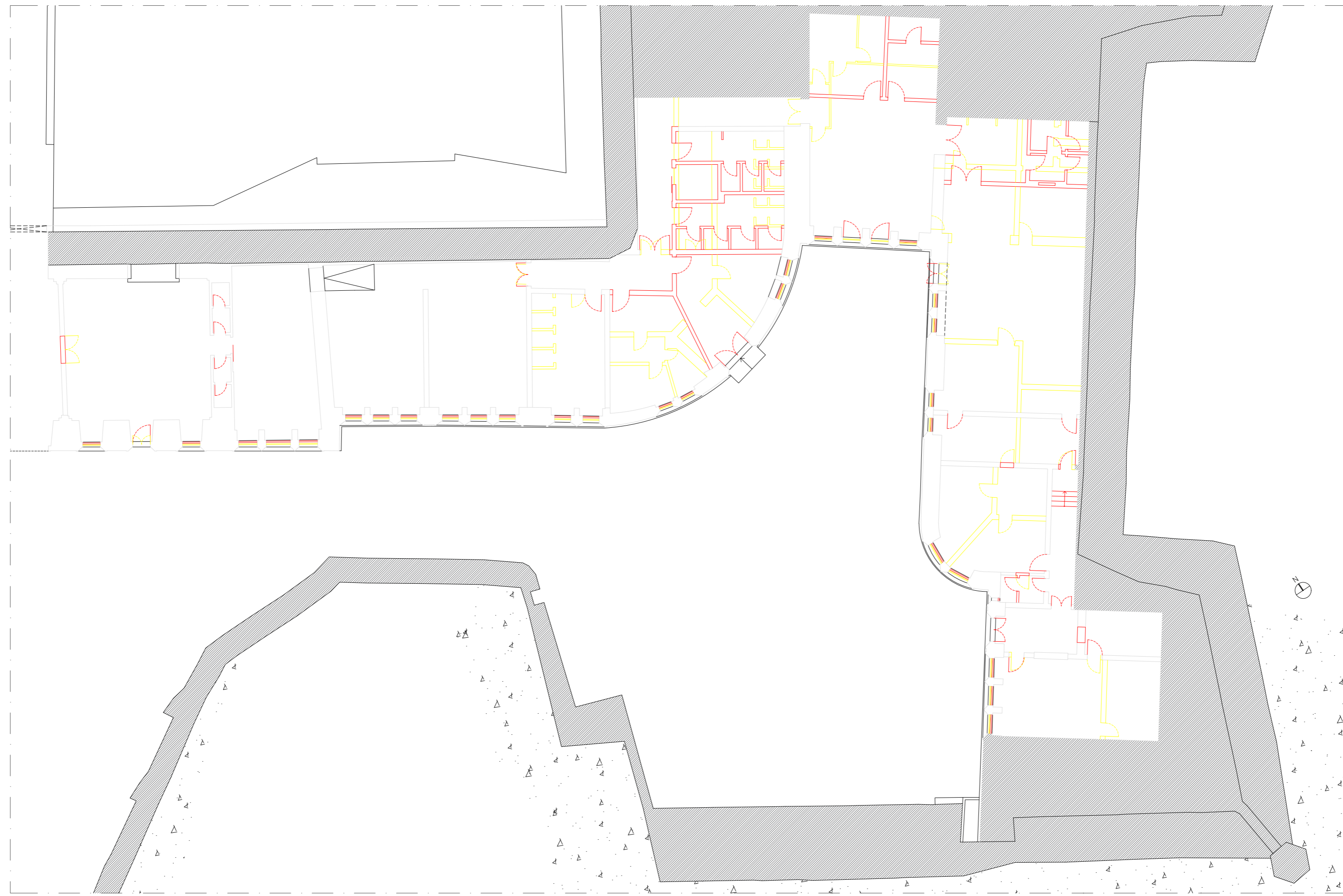
PLANTA PISO TÉRREO