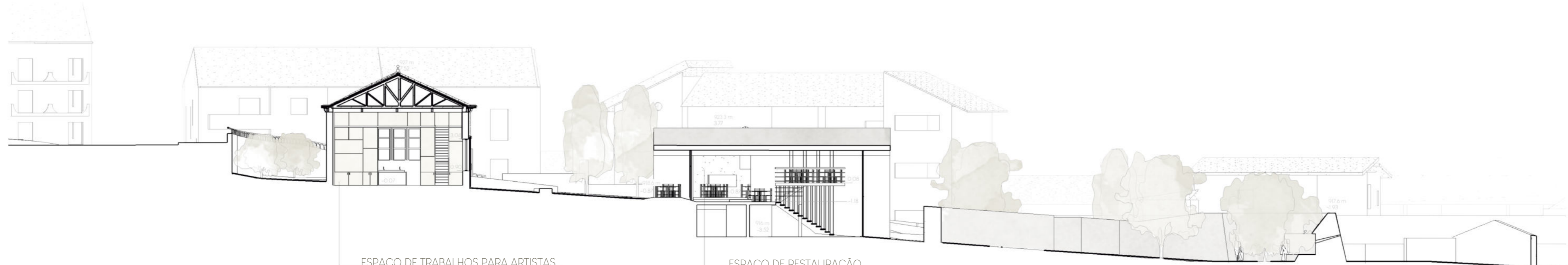
CORTE IV EI/200