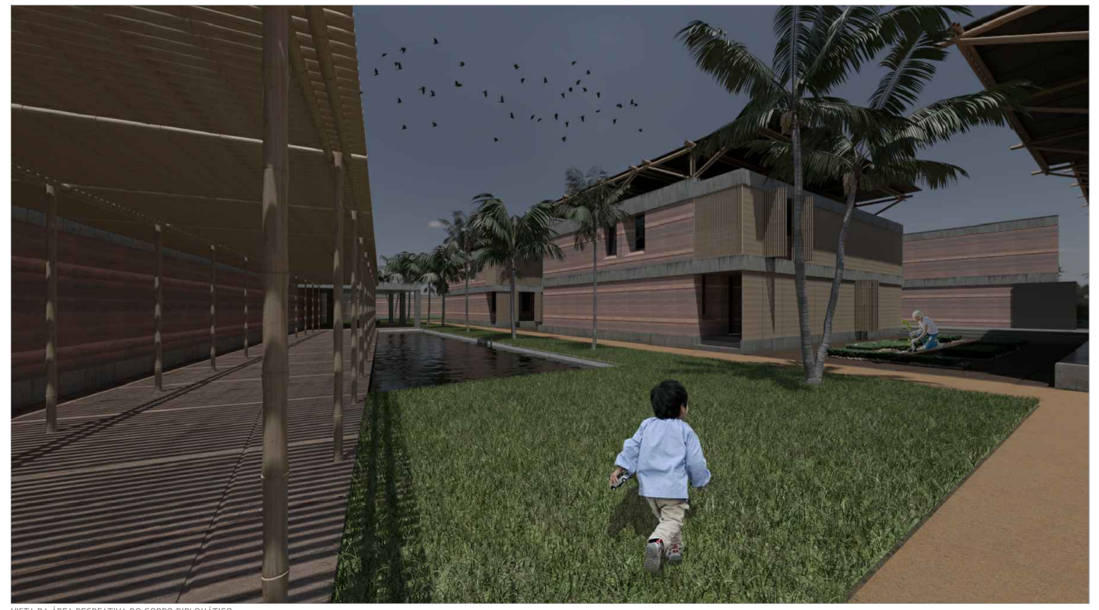
VISTA DA ÁREA RECREATIVA DO CORPO DIPLOMÁTICO