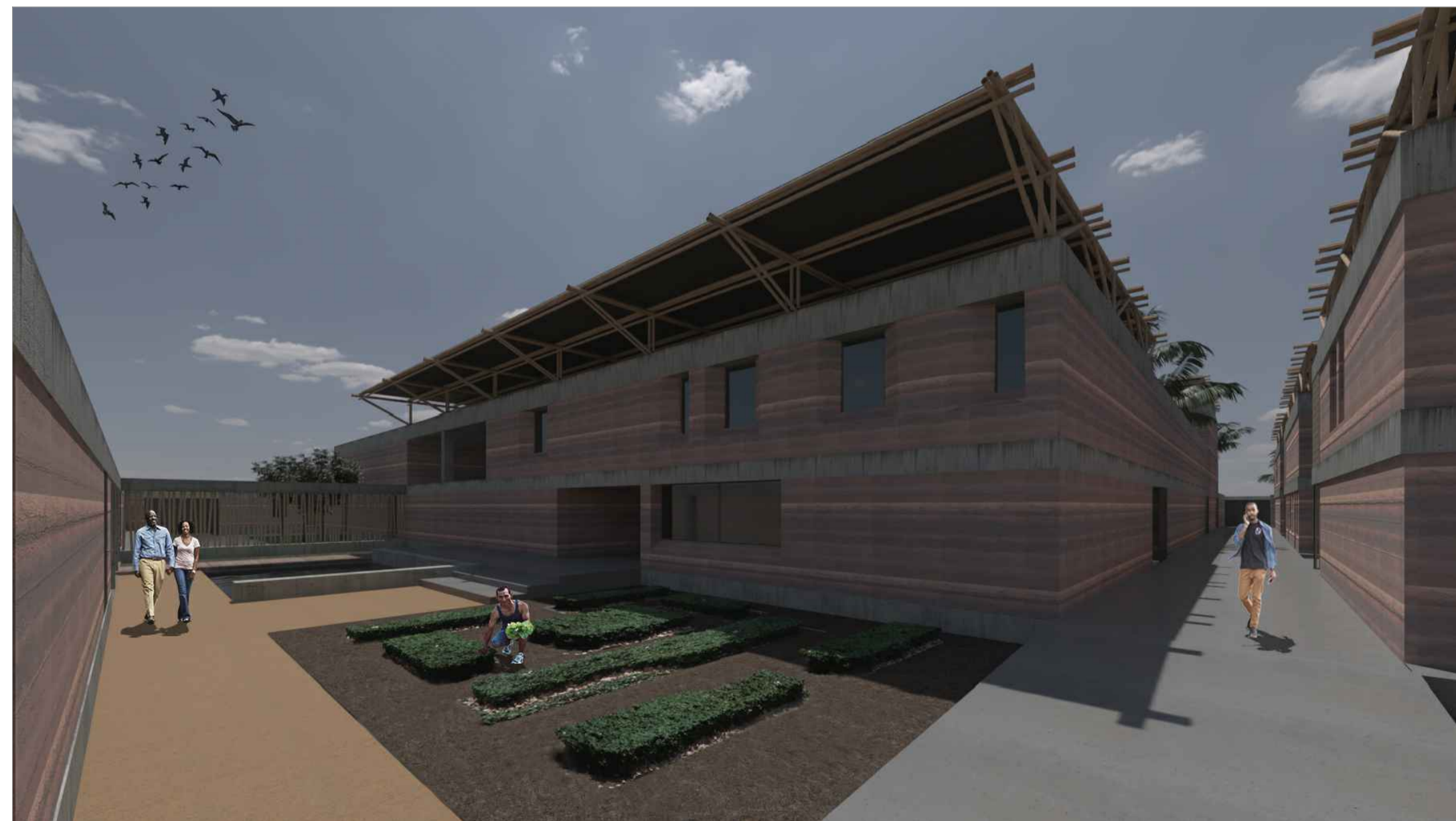
VISTA DA ENTRADA DA RESIDÊNCIA DO EMBAIXADOR