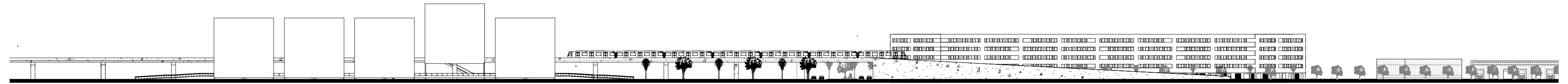
PERFIL TRANSVERSAL BB' esc. 1/1000