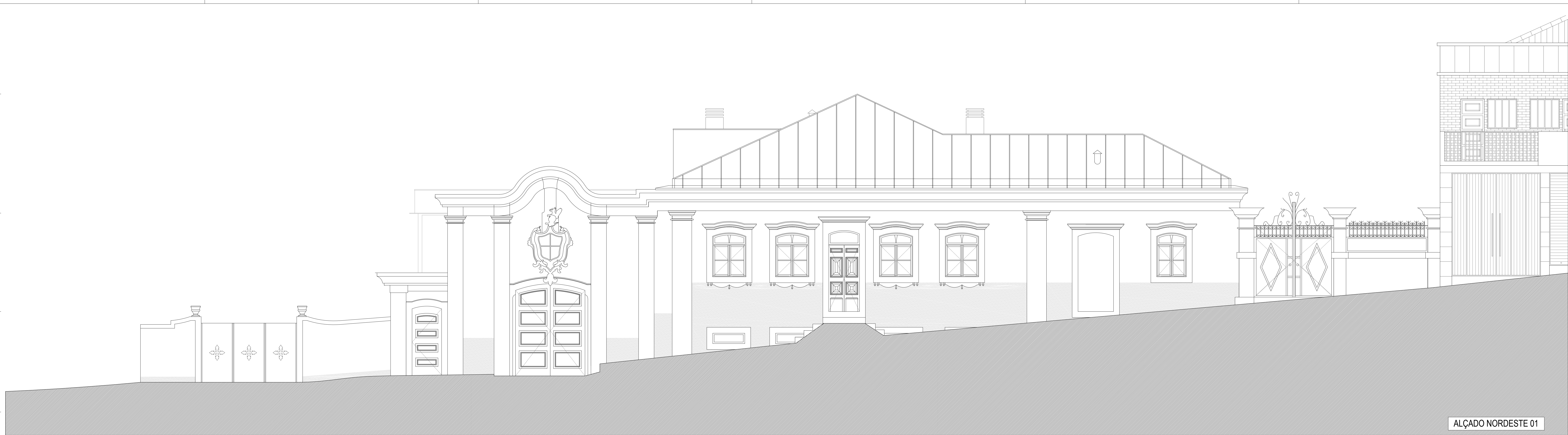
ALÇADO NORDESTE 01

+10.46 CUMEIRA +6.33 PISO 2 +3.40 PISO 1 0.00 PISO TERREO