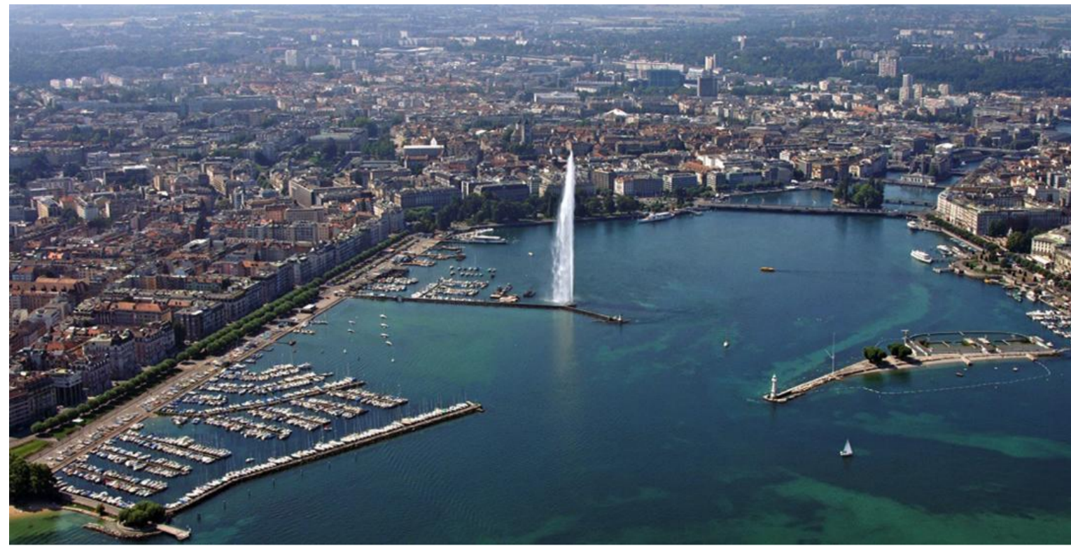
Fotografia aérea da cidade de Genebra e do lago de léman