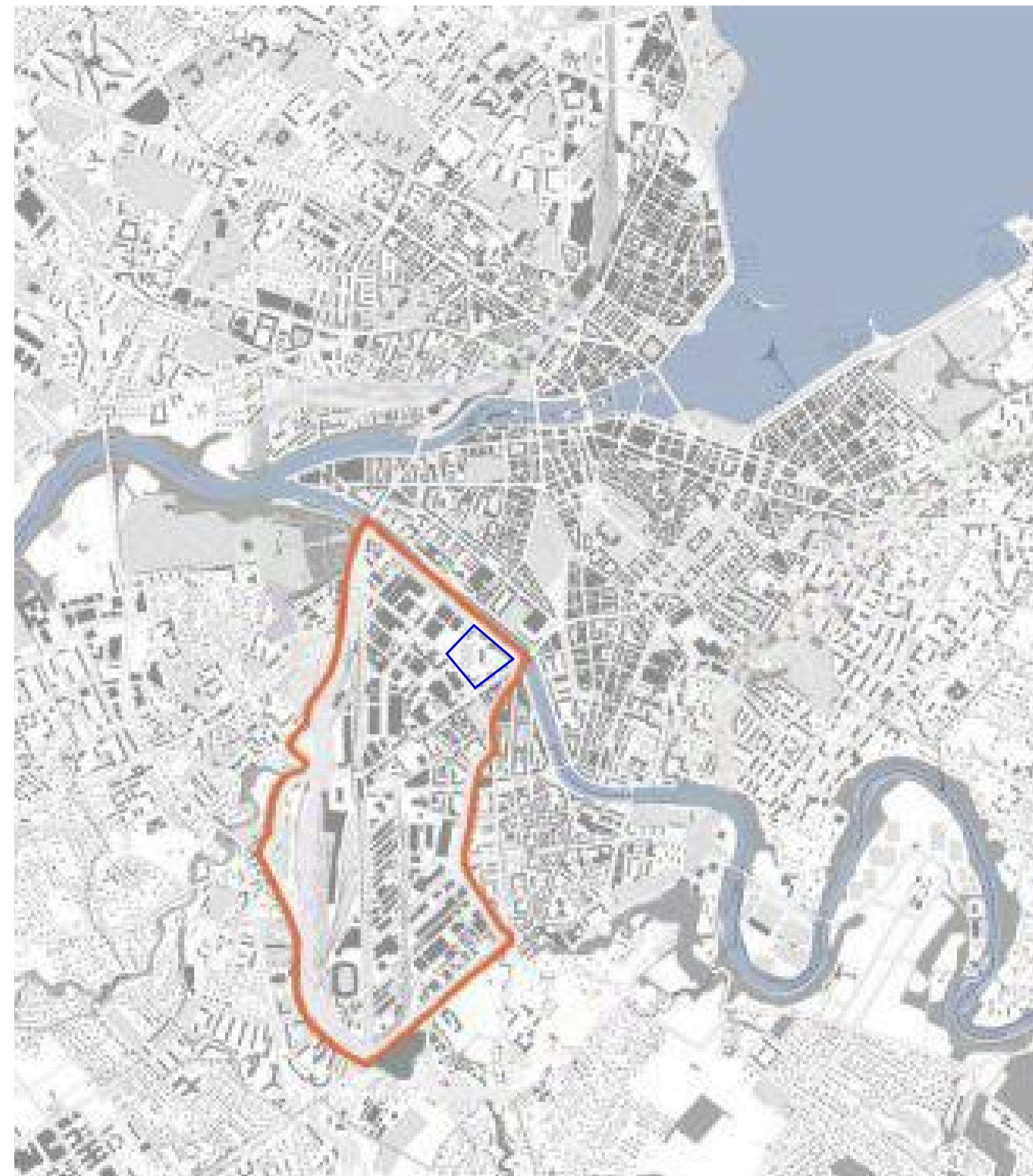
Fig. 1 - Localização do perímetro de intervenção do projeto urbanístico (PAV) e do projeto prático (OV) em Genebra