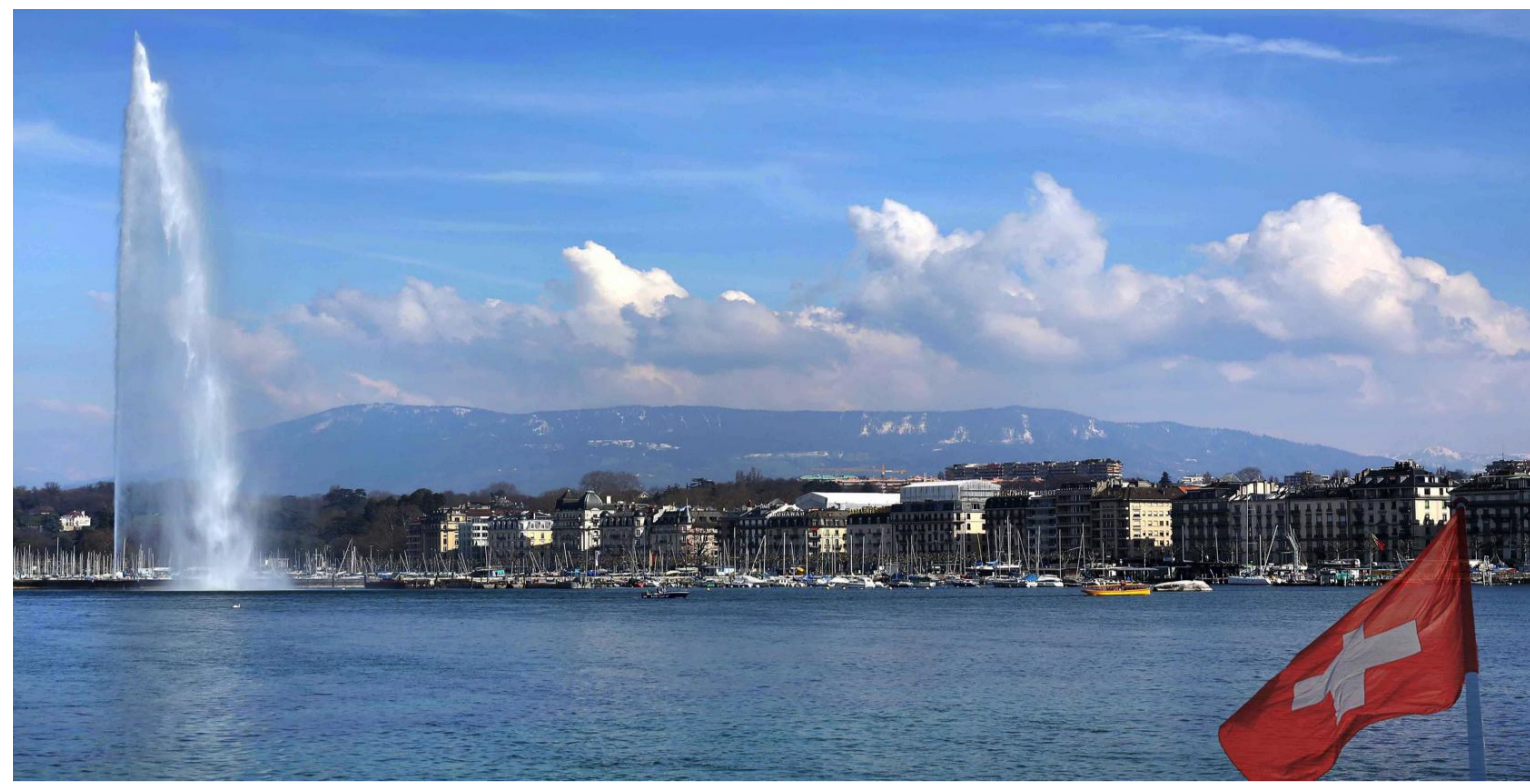
Fotografia da cidade de Genebra e do lago de léman