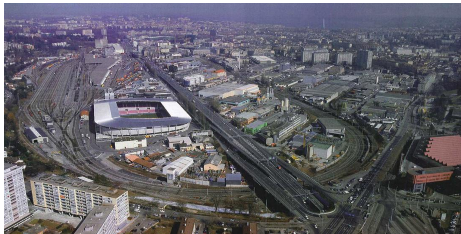
Fotografia aérea do perímetro de intervenção do projeto urbanístico (PAV) - FA 2