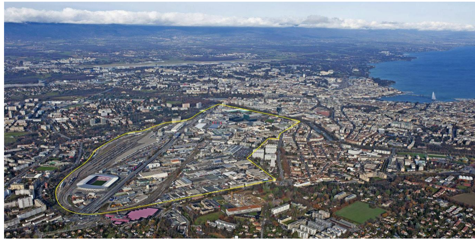
Fotografia aérea do perímetro de intervenção do projeto urbanístico (PAV) - FA 1