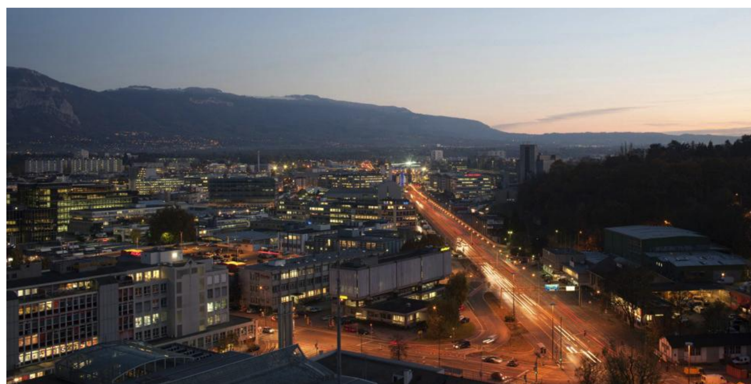
Fotografia aérea do perímetro de intervenção do projeto urbanístico (PAV) - FA 3