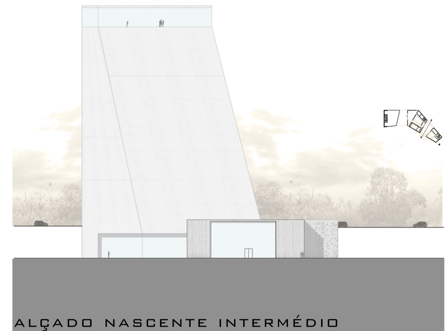
ALÇADO NASCENTE INTERMÉDIO