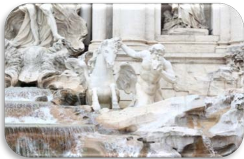
Ilustração 1 Fontana di Trevi

Como ilustração, seguem-se algumas fotografias da cidade que continua a encantar os visitantes.