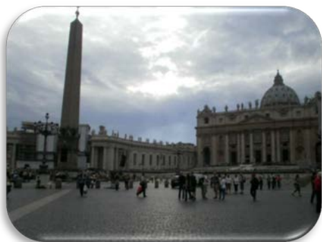
Ilustração 5 Piazza di San Pietro