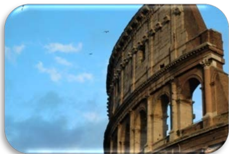
Ilustração 3 Coliseu de Roma