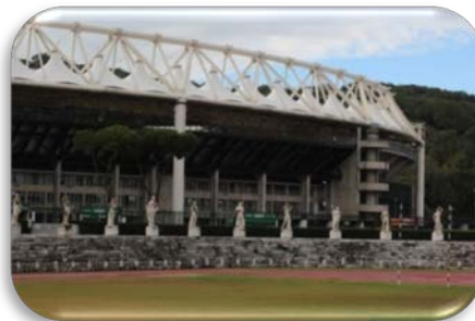
Ilustração 2 Estádio de Mármore e Estádio de Roma ao Fundo