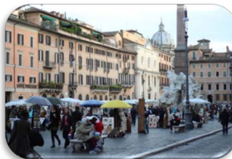
Ilustração 4 Piazza Navona