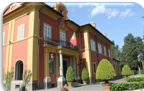
Ilustração da Embaixada de Portugal em Roma.

O conceito de direito de Embaixada surge devido às divergências entre imperadores, monarcas e papas. Este conceito não era definido como uma qualidade de soberania, mas apenas como um método de poder comunicar formalmente. A palavra Embaixada começa a ser utilizada no sentido mais atual, no século XII, em Itália de forma a representar o ato de