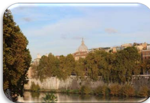
Ilustração 6 Rio Tibre