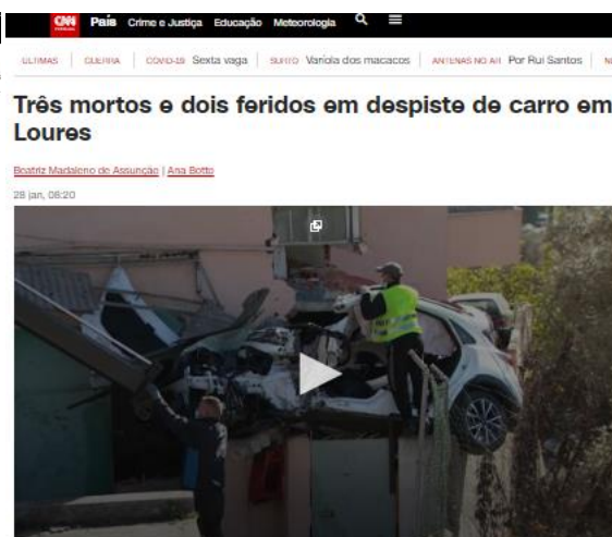
Figura 6. Peça sem o vídeo para ilustrar

Acidente ocorreu durante a madrugada. Um dos feridos está em estado grave