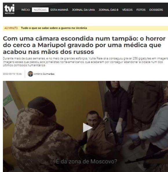
Figura 5. A mesma peça publicada no site da TVI

O próprio ticker da CNN Portugal é feito pelos jornalistas do online , devido à instantaneidade com que recebem as informações. Geralmente, as notícias saem primeiro no online do que na televisão, o que por vezes obriga a publicar uma peça sem imagem. Assim que chegam as primeiras imagens para a emissão televisiva, a peça é atualizada ( figuras 6 e 7 ).