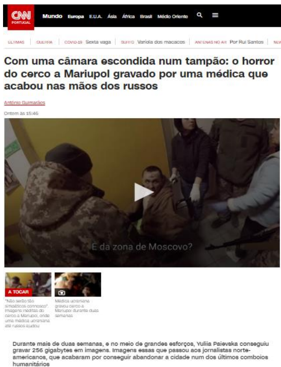
Figura 4. Peça publicada no site da CNN Portugal