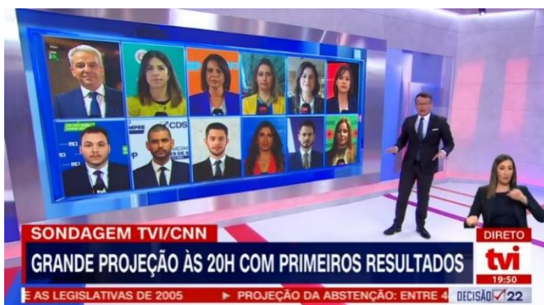
Figura 3. Plano dos repórteres nas sedes de campanha

Na tarde das eleições, a redação ainda estava calma, mas à medida que se aproximavam das 19h45, começa a notar-se uma certa agitação. Na sala da produção (central), preparam-se as ligações com os repórteres que se encontram nas sedes de campanha de cada candidato. A coordenadora da produção pede a cada um dos repórteres um plano para depois as fotografias serem integradas na emissão ( figura 3 ).