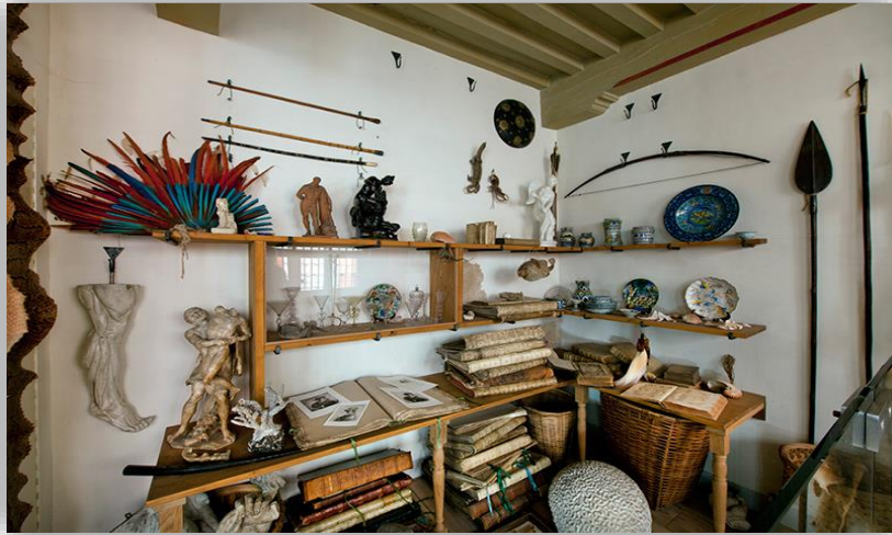
Figura 4. Pormenor do gabinete de curiosidades, situação atual, no Museu Het Rembrandthuis, Amesterdão.

Esse domicílio de Rembrandt situa-se nas proximidades da grande sinagoga portuguesa, num bairro que, nos séculos XVI e XVII, acolhia muitos migrantes, inclusivamente centenas de pessoas de ascendência africana. A gravura da Figura 5 apresenta, no interior da sinagoga, homens de chapéu que seguram livros, e, menos visível, um homem de pele escura e sem chapéu.