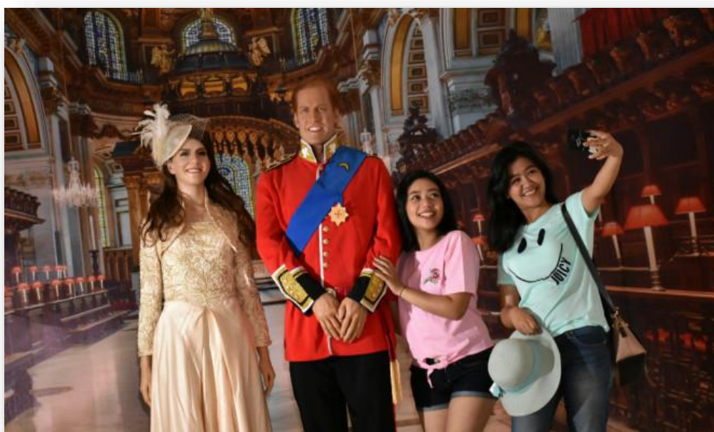
Figura 9. Realeza britânica no Museu Angkut, Malang, Indonésia.

Outras práticas de lazer e de consumo cultural que mostram essa globalização pertencem à área do turismo. As classes médias dos países em desenvolvimento realizam cada vez mais viagens pelo mundo, ou, mais comum ainda, visitam no seu próprio país museus e parques temáticos onde podem ser vistas réplicas de pontos de referência do Ocidente, tais como a Torre Eiffel ou a Estátua da Liberdade, ou a própria rainha Isabel II e outras celebridades (Figura 9).