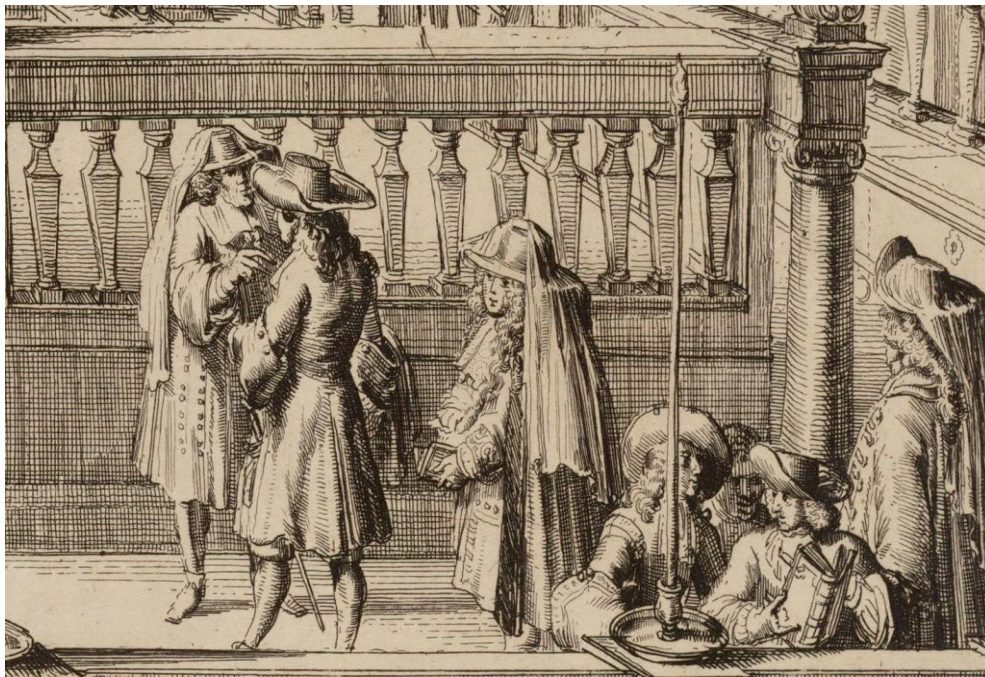
Figura 5. Interior da sinagoga Português- Israelita com a bima . Detalhe da gravura por Romeijn de Hooghe, De Predikstoel en Binnen Transen , (Amesterdão, 1675. Atlas Dreesmann, Coleção Arquivo Municipal, Amesterdão, detalhe reproduzido em Mark Ponte, 2019, p. 49).

Esse domicílio de Rembrandt situa-se nas proximidades da grande sinagoga portuguesa, num bairro que, nos séculos XVI e XVII, acolhia muitos migrantes, inclusivamente centenas de pessoas de ascendência africana. A gravura da Figura 5 apresenta, no interior da sinagoga, homens de chapéu que seguram livros, e, menos visível, um homem de pele escura e sem chapéu.