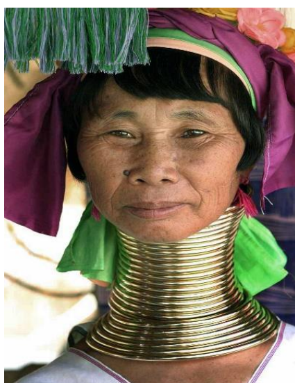
Figura 2. Mulher Padaung.

Viajantes e cronistas (portanto não-antropólogos), em contacto com outros povos, focaram e focam frequentemente esses assuntos ‘bizarros’. Como exemplo, referimos o grupo etnolinguístico Padaung (também conhecidos como Palaung ou Kayan Lahwi), do norte da Tailândia e da Birmânia (Myanmar), onde muitas raparigas se sujeitam a uma intervenção sobre o seu corpo. Por meio de uma aplicação gradual de argolas no pescoço, as clavículas são suprimidas, e o pescoço alonga-se, como se pode ver na fotografia (Figura 2). Este grupo étnico tem recebido muita atenção da comunicação social, apenas focada neste hábito de mutilação das mulheres, de tal forma que os Padaung são conhecidos como ‘a tribo das mulheres girafa’ – um termo que é não só arrepiante mas também redutor. Assinale-se que o próprio nome ‘Padaung’ significa ‘pescoços compridos’ na língua dos Shan, o grupo étnico dominante no nordeste da Birmânia 11 .