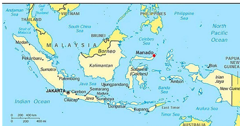
Figura 1. Mapa da Indonésia. Minahasa situa-se na península norte de Sulawesi, sendo Manado a cidade de referência.

norte da ilha de Sulawesi, na Indonésia 4 . Tive, então, ocasião de conhecer bem a comunidade e de aprender, de forma rudimentar, as línguas que ali se falavam; estar presente naquele lugar em todas as estações do ano e testemunhar as atividades e discursos daquelas gentes, mas também, com o passar do tempo, ter acesso a informações, sensações e ideias sobre assuntos mais íntimos ou polémicos.