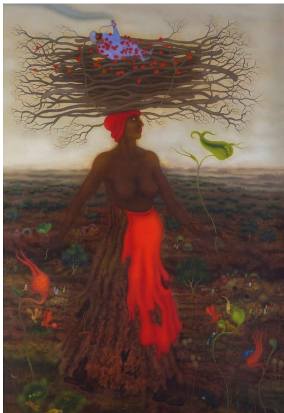
Figura 10. Arik Brauer, Im Würde , 2008. Fonte: Brochura Arik Brauer Phantastisch-Realistisch. Ein Lebenswerk. (Exposição em Erfurt, Agosto 2019).

Estado com boas políticas sociais ou num Estado com traços fortes de neoliberalismo. No combate às injustiças, uma investigação empenhada é necessária. O estudo das desigualdades, a nível global, nacional e micro, é um dos grandes temas das Ciências Sociais, e essas desigualdades são, muitas vezes, assinaladas como uma das principais causas dos outros grandes problemas existentes nas sociedades 39 .