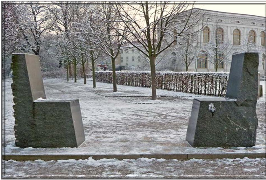
Figura 8. Monumento Hafiz-Goethe, Weimar.

Poucos anos depois de Goethe redigir estes versos, havia de se desenvolver o imperialismo, durante o qual as nações ocidentais viriam a assegurar o poder sobre outras nações, inclusivamente no Oriente. The West and the Rest passou a ser a caracterização do mundo de então, no qual o Ocidente se assumiu como superior relativamente ao the Rest , ou seja, todas as outras populações foram colocadas no mesmo cesto. Hoje, na época pós-colonial, nota-se, por exemplo por parte das organizações internacionais, a vontade de diálogo e de respeito por outras culturas, em toda a sua diversidade. Mas há numerosas tendências preocupantes de hostilidade e, demasiadas vezes, de violência entre grupos ou indivíduos. Não vou aprofundar agora esta temática, precisamente pela sua complexidade, mas as Ciências Sociais têm muito para dizer sobre esta questão.