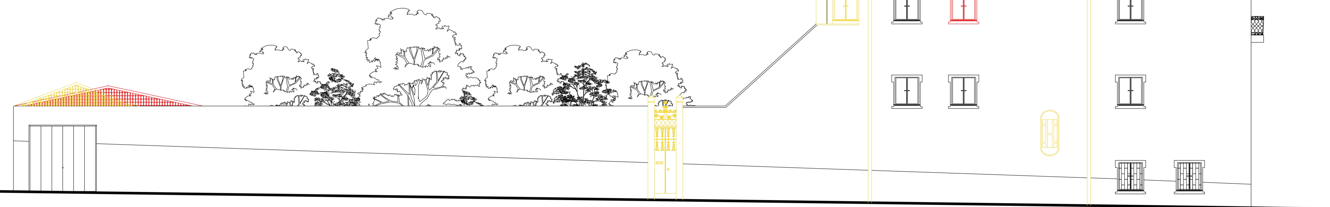
Alçado lateral esquerdo