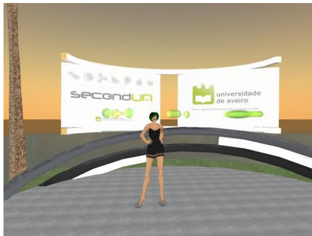
Ilustração 2: Encontro da UA no Second Life

Ora as RP deveriam dar um primeiro passo na sensibilização e informação destes meios que já estão ao dispor de cerca de cinco milhões de pessoa em todo o mundo.