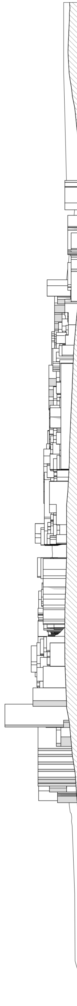
Corte transversal 4 _ Rua Francisco António Diniz