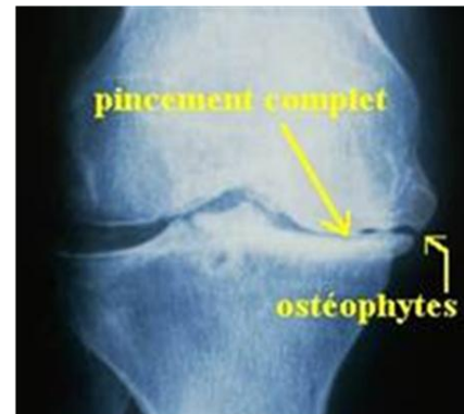
Fig.2 Artrose do joelho estabelecida

Estudos laboratoriais sistémicos são normais, caso não haja patologias concomitantes.