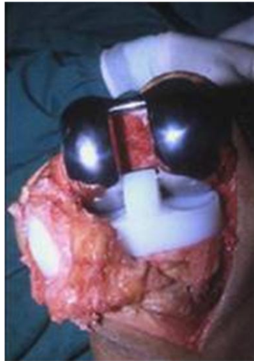
Fig.5 fase final de uma artroplastia do joelho in www.gonartrose.com

foram introduzidas por Insall e seus colaboradores, em 1972, época que marcou assim o início da era moderna da artroplastia do joelho. 74 A técnica consiste essencialmente de ressecção da cartilagem articular afectada, e sua substituição por próteses de metal ou polietileno. Trata-se de uma cirurgia electiva e deve ser realizada apenas após uma exaustiva revisão e balanço dos potenciais riscos e benefícios. A artroplastia não modifica o curso da