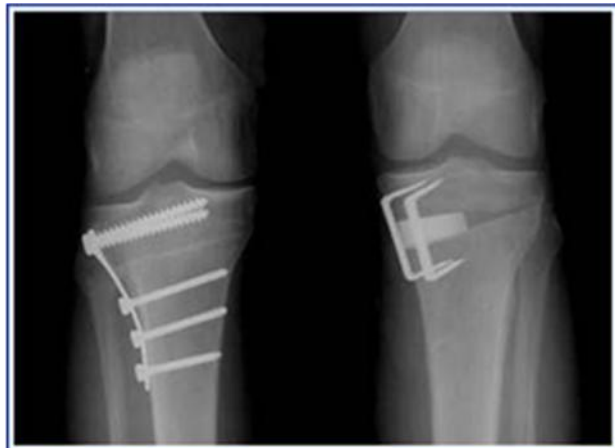
Fig.4 Osteotomias: fechada (esq) e aberta (drt) in www.grupodojoelho.com.br/osteotomias.jpg

A osteotomia é um procedimento cirúrgico, cuja introdução se deu em 1960. 44 Nesta técnica cirúrgica, efectua-se um corte ao nível do osso (osteotomia), alterando a sua posição e corrigindo o seu alinhamento, de modo a redistribuir a carga do peso corporal pelos compartimentos não afectados. Este último é mesmo considerado o objectivo principal desta cirurgia, com a consequente redução dos