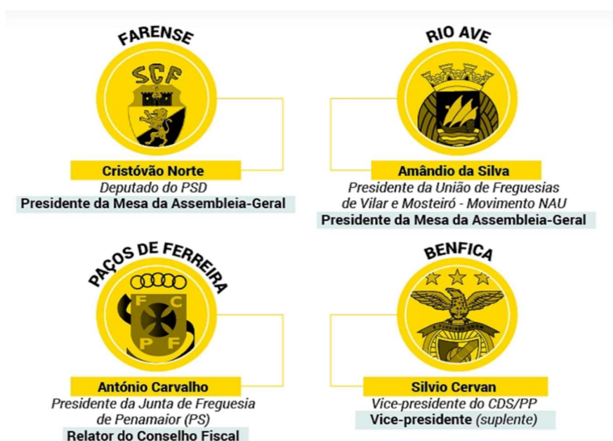
Figura 3 – Lista de nomes dos vários clubes (Cont.)

Fonte: https://poligrafo.sapo.pt (21/09/2020). Consultado a 20 de setembro de 2023.