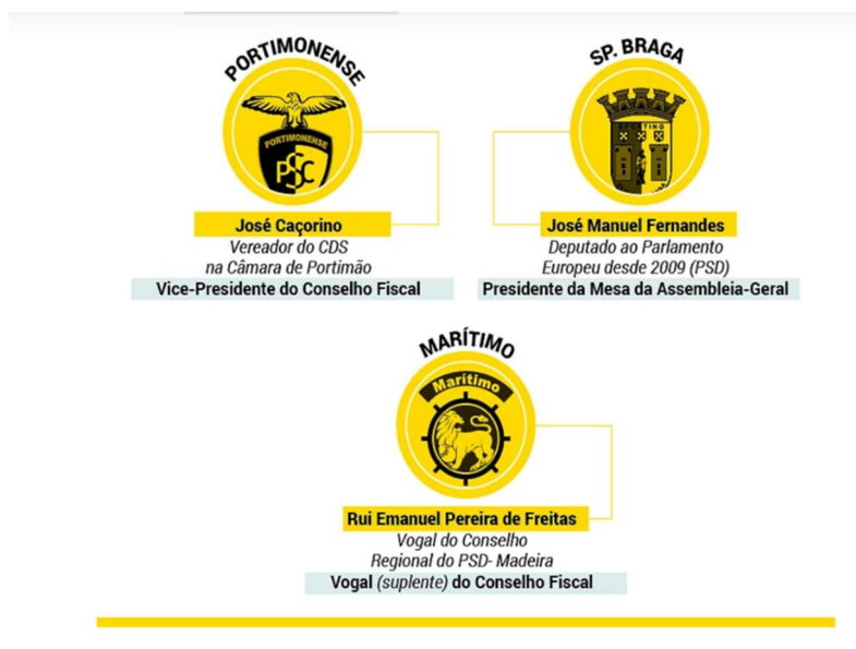
Figura 4 - Lista de nomes dos vários clubes (Cont.)

Fonte: https://poligrafo.sapo.pt (21/09/2020). Consultado a 20 de setembro de 2023.