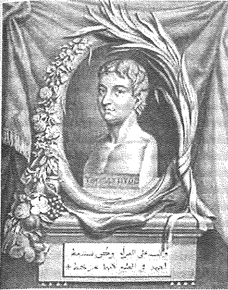
Thomas Hyde (1636-1703).

explicativa, ele representa o extremar mental das experiências de dualidade ou polaridades que decorrem da situação do Homem no cosmos: o dia e a noite, o macho e a fêmea, o céu e a terra, a direita e a esquerda, o movimento e o repouso, o quente e o frio, a vida e a morte, etc. Como se a própria consciência, na sua origem, não pudesse deixar de ser dualista e maniqueizante, só se apreendendo a si mesma em ato de divisão/distinção, que logo pretende superar dialeticamente.