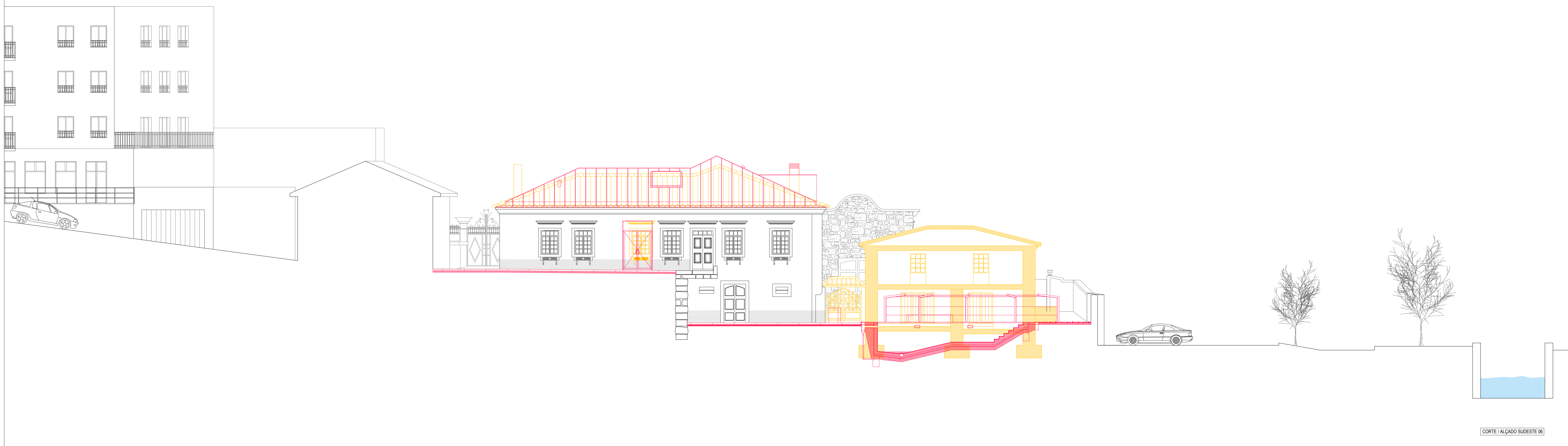
CORTE ALÇADO SUDESTE 06

LEGENDA TRAMAS A MANTER A CONSTRUIR A DEMOLIR