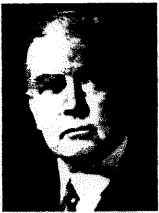
John Raleigh Mott