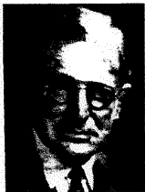
Sir Nevill F. Mott