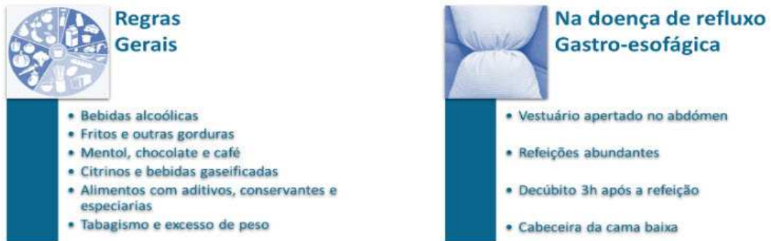
Figura 2 - Ilustração do que evitar antes de terapêutica com IBP 85

Caso um doente já tenha iniciado a terapêutica com IBP e esta não for necessária e a situação clínica justificar a sua interrupção, esta deve ser gradual, reduzir a dose a 50% durante 1-2 semanas e suspender o IBP após uma semana com a menor dose.