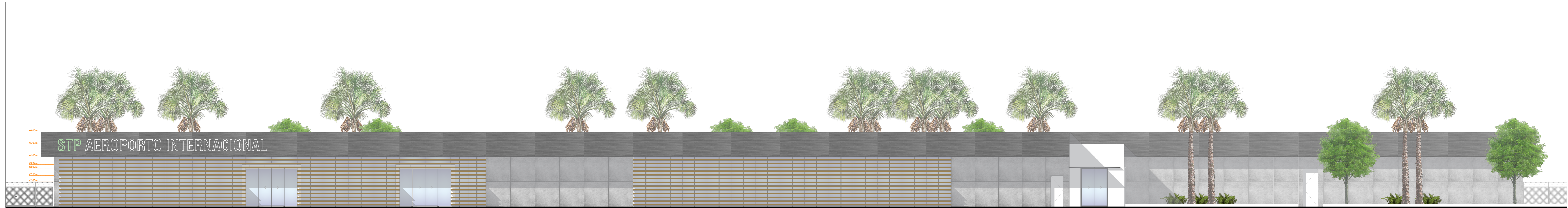
ALÇADO - PRINCIPAL TERMINAL