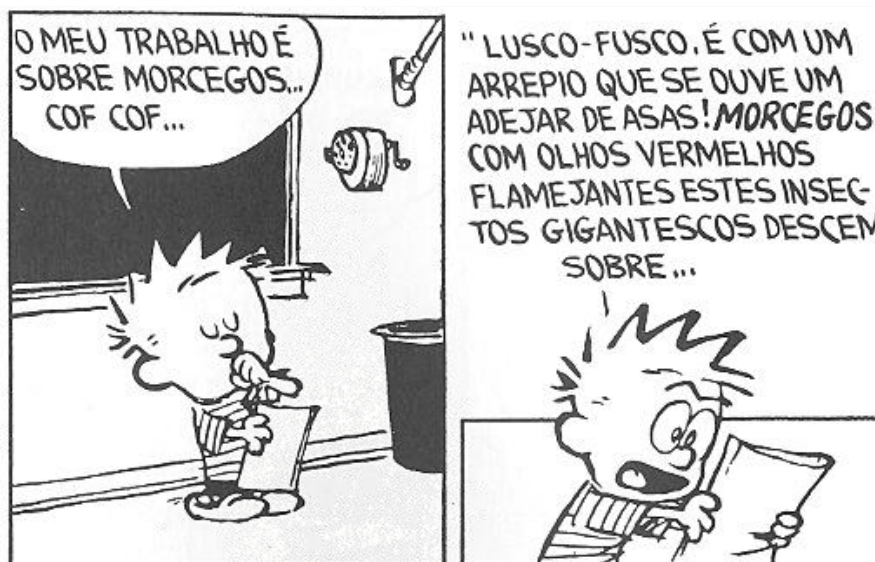
Bill Watterson, Parabéns Calvin & Hobbes, Lisboa, Gradiva, 1995, p. 98