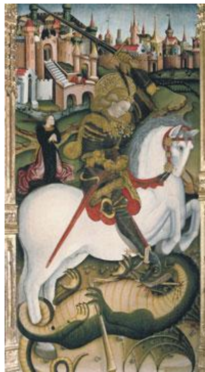
Jaume Ferrer II (s. XV). Retablo. Escuela Catalana. Ayuntamiento de Lleida.

Esta misma leyenda, con ligeras variaciones, se repite en las tradiciones populares de Inglaterra, Portugal y Grecia, entre otros países.