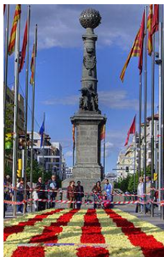
Plaza de Aragón de Zaragoza el día de San Jorge.

Además, el Día de Sant Jordi tiene un aspecto reivindicativo de la cultura catalana y aragonesa y muchos balcones lucen la bandera de la nación o de la comunidad autónoma. En toda Cataluña se venden cromos y llaveros llegando a su máxima expresión en las Ramblas . Normalmente también se realizan actividades en las bibliotecas y conciertos en las calles que se añaden a la agenda cultural de la Ciudad Condal.