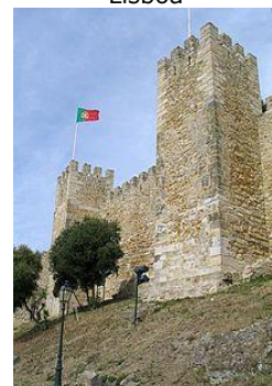
El castillo de São Jorge en Lisboa

In http://www.gencat.cat/catalunya/cas/llegenda.htm y http://es.wikipedia.org/wiki/D%C3%ADa_de_San_Jorge