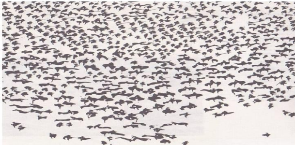
Nem sempre é redondo