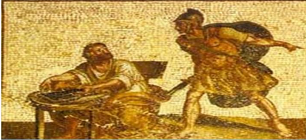
Na Época Clássica