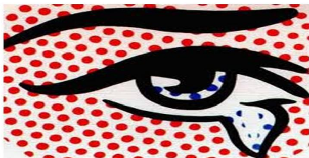
Na Pop Art

·Com o movimento da Pop Art, surge também uma nova projecção do Ponto e artistas como Roy Lichtenstein (1923-1997) utilizam o ponto com muita frequência nas suas obras;