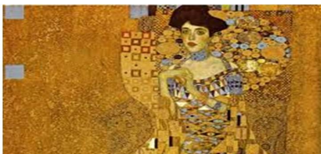
No Pós Impressionismo

·Gustav Klimt (1862-1918) surge no movimento Pós Impressionista e recorre variadas vezes ao Ponto, como elemento estruturante da sua Obra;