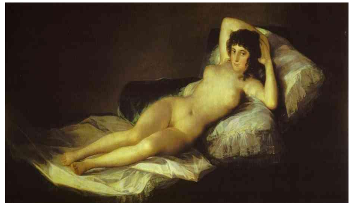
La maja desnuda,

tendência contra as concepções anteriores de arte e o desejo de uma nova forma de expressão. Para entender o alcance da arte de Goya, e apreciar os princípios que orientaram o seu desenvolvimento e enorme versatilidade, é essencial entender que a sua obra se estendeu por um período de mais de 60 anos, pois continuou a desenhar e pintar até aos 82 anos.