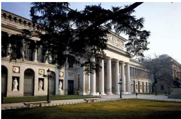
Edifício Villanueva, Porta de Velásquez, (fachada Paseo del Prado).