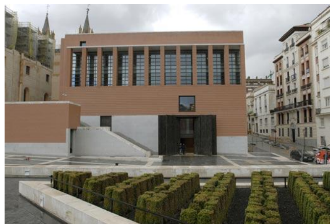
Ampliação do Museu do Prado realizada pelo arquitecto Rafael Moneo.

Tanto a colecção como o número de visitantes do Prado aumentaram significativamente ao longo XIX e XX, pelo que o Museu foi sendo sucessivamente ampliado na sua sede histórica até esgotar totalmente as possibilidades de intervenção neste edifício. Por este motivo, o Prado viu-se obrigado a encontrar um caminho para a sua actual ampliação através de uma solução arquitectónica na nova fábrica ao lado da fachada posterior da sua sede tradicional e ligado com esta pelo seu interior.