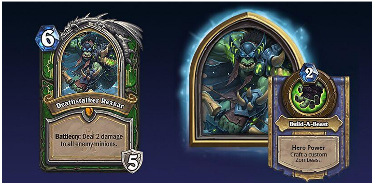
Figura 30 – Deathstalker Rexxar e o seu “Hero Power” que permite ao jogador criar cartas customizadas, Hearthstone (Blizzard Entertainment, 2014)

se adaptar para um jogo de cartas colecionáveis físico, como ainda existe o detalhe de que o jogador é apresentado dois grupos de três cartas do tipo besta para criar a sua carta customizada, sendo que as cartas apresentadas provêm da base de dados de todas as cartas de besta alguma vez impressas durante a vida do jogo, independentemente de o jogador as possuir na sua coleção ou não.