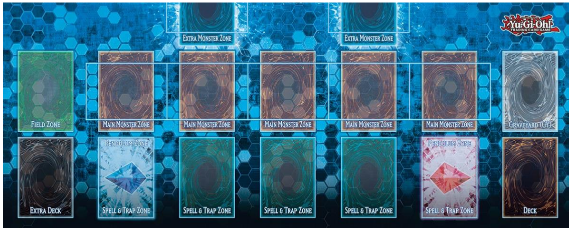
Figura 13 – Campo de jogo de Yu-Gi-Oh!, (Konami, 1999)

Tema do Jogo: Yu-Gi-Oh! é uma adaptação do jogo Duel Monsters, presente na Manga de Kazuki Takahashi de 1996, como tal, o jogador interpreta o papel de um duelista que utiliza as suas cartas para ganhar contra o oponente. Apesar da aparente simplicidade do tema, e da forte influência do Egito antigo na Manga , as cartas de jogo em si podem refletir qualquer tema que os criadores assim desejarem. Existindo cartas que representam maquinaria avançada, figuras fantásticas e mitológicas, e qualquer tema entre ambos. Ao contrário de Magic: the Gathering, não existe uma linha narrativa que une todas as cartas do jogo, sendo que algumas seguem histórias com outras cartas, ou têm narrativas completamente próprias.