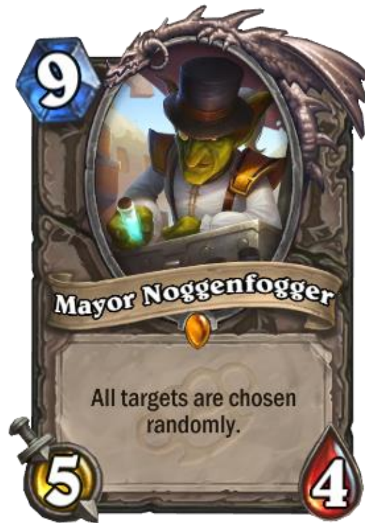
Figura 29 – Baron Noggenfogge, Hearthstone (Blizard Entertainment, 2014)

possibilidade de alguns jogadores, assumindo que estes tivessem as ferramentas para sequer as calcular.