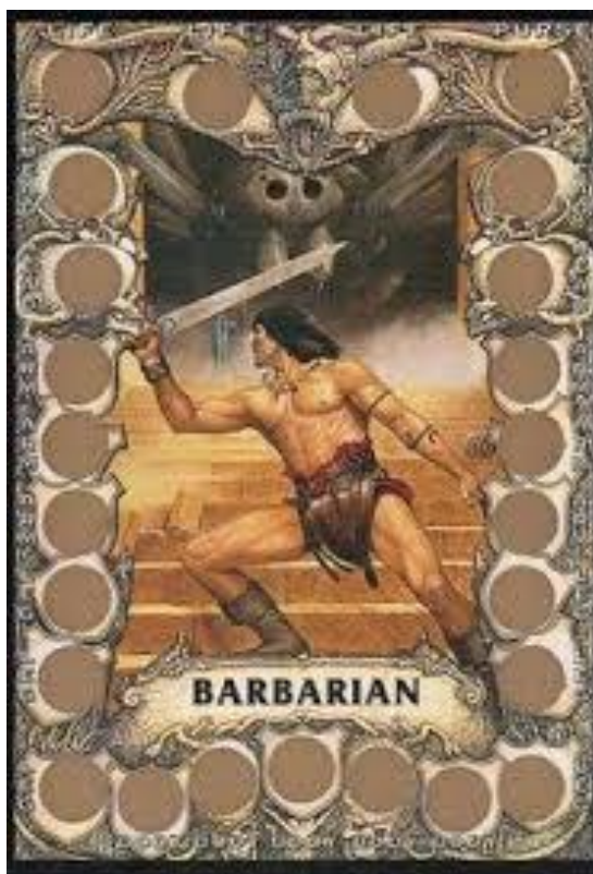
Figura 12 – Carta Barbarian no qual podemos observar círculos bronze os redor da carta que os jogadores teriam de raspar para revelar os valores escondidos, BattleCards, (Merlin Publishing, 1993)