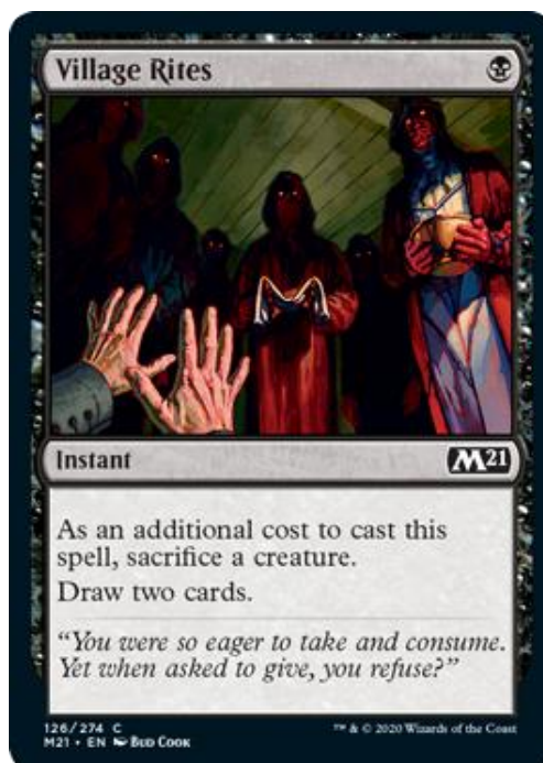
Figura 20 – Village Rites, Magic: the Gathering, (Wizards of the Coast, 1993)

A existência de um sistema de custo é comum a todos os jogos de cartas analisados, apesar destes tomarem formas diferentes. Como no caso de jogos como Pokémon Trading Card Game, que inclui um sistema de evolução, no qual certas cartas mais poderosas só podem ser jogadas caso o jogador em questão já controle a sua pré-evolução em campo. Adicionalmente os ataques de cada Pokémon só podem ser ativados caso cartas de Energy lhes cubram os custos de ativação, similarmente ao sistema de Mana em Magic: the Gathering. Já Yu-Gi-Oh! por exemplo, tem um sistema de Levels , nos quais as suas cartas de Monster só podem ser invocados caso o jogador em questão sacrifique o número apropriado de monstros em campo, sendo este número definido pelo nível do monstro a ser invocado. Outros custos adicionais podem aparecer nas caixas de Habilidades das cartas, como no caso de Village Rites (Figura 20), que para além do custo de Mana , indicado no canto superior da carta, contém ainda o custo adicional de se sacrificar uma criatura quando este é jogado especificado na sua caixa da Habilidade.