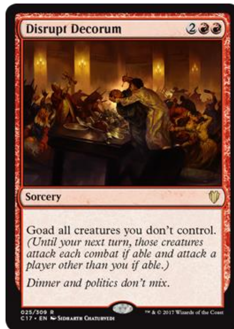
Figura 14 – Disrupt Decorum, Magic: the Gathering (Wizards of the Coast, 1993)

jogar um contra o outro, esta mecânica simplesmente obriga o adversário a atacar de possível, ignorando toda a faceta de virar os adversários uns contra os outros. Podemos então observar que, apesar de esta carta poder ser jogada num ambiente para além de uma partida com mais de dois jogadores, metade do seu texto torna-se obsoleto, perdendo assim o seu intuito original.