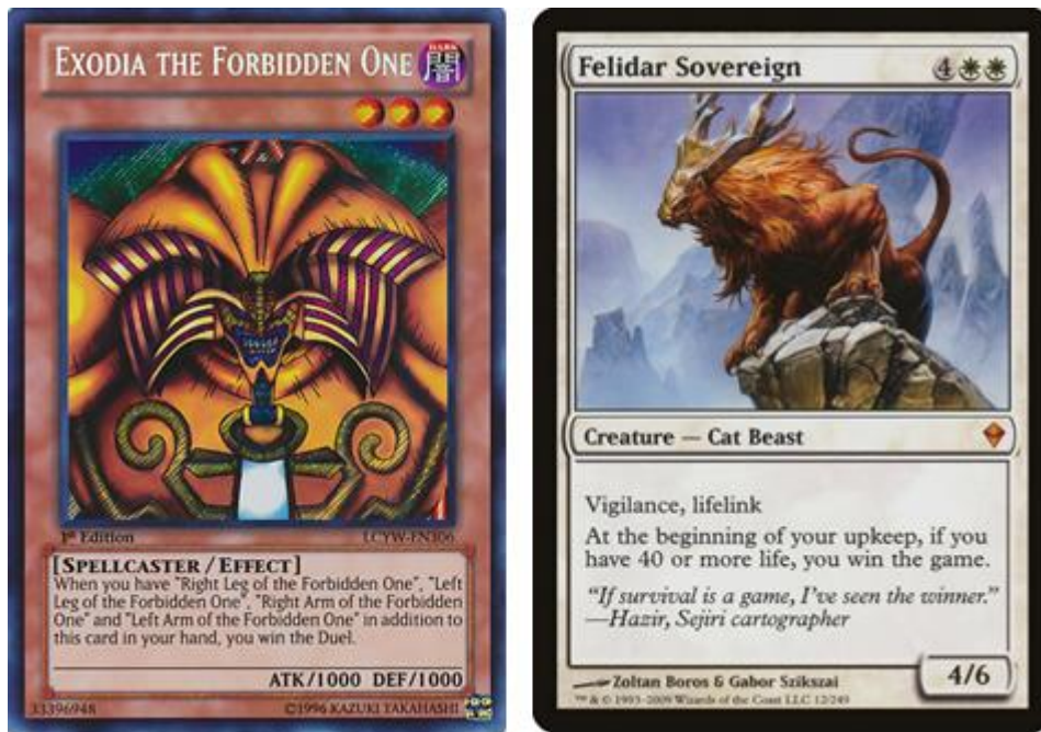
Figura 15 – (Esquerda) Exodia the Forbidden One, Yu-Gi-Oh! (Konami, 1999). (Direita) Felidar Sovereign, Magic: the Gathering, (Wizards of the Coast, 1993)