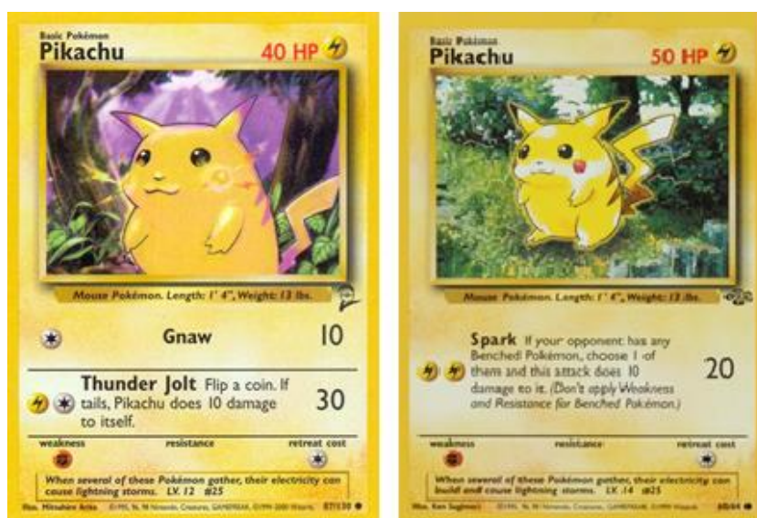
Figura 18 – (Esquerda) Pikachu Base Set, (Direita) Pikachu Jungle Set, Pokémon Trading Card Game, (Media Factory, 1996)