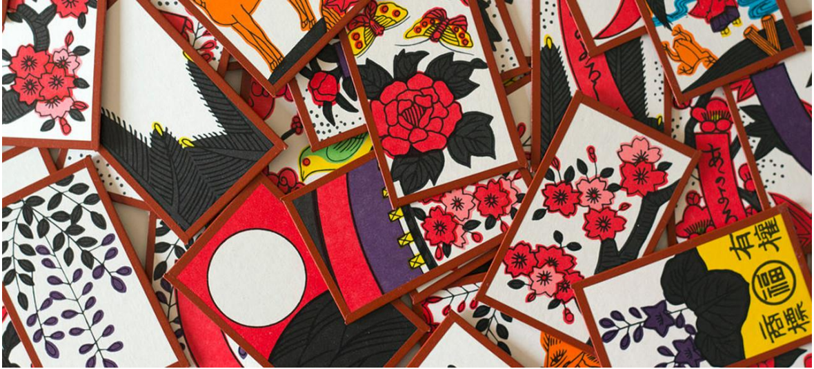
Figura 6 – Cartas de Hanafuda