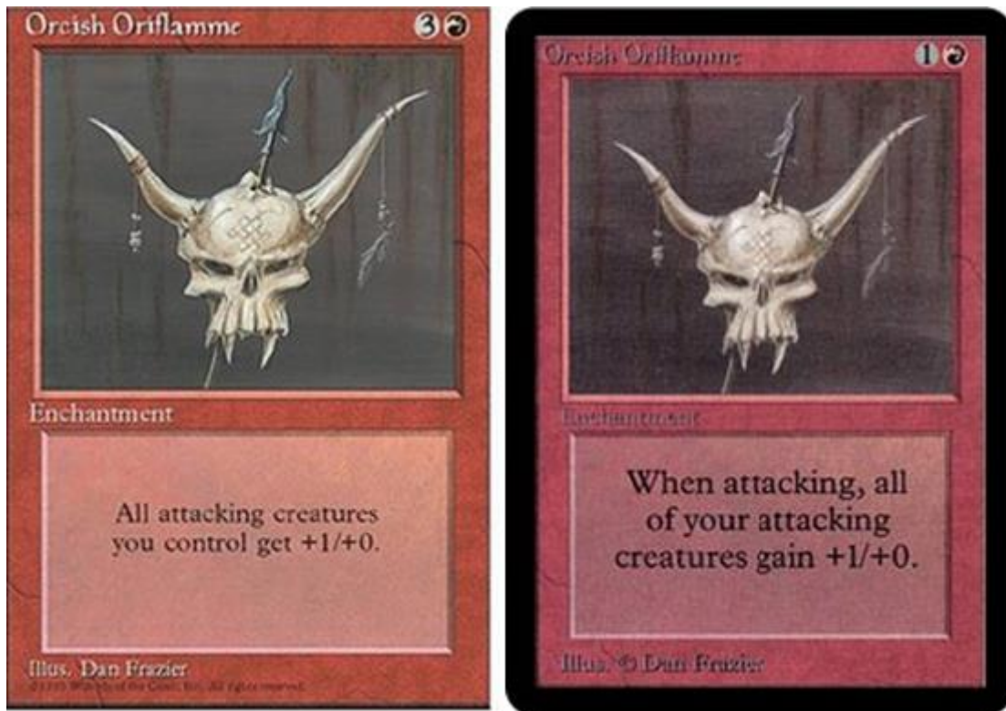
Figura 27 – (Esquerda) Orcish Oriflamme com o custo de mana correto (canto superior direito), (Direita) Orcish Oriflamme com erro de impressão que reduzia o custo de mana total em metade, Magic: the Gathering (Wizards of the Coast, 1993)

Por outro lado, também se pode dar o caso de uma carta ser mais fraca ou forte do que esperado e /ou novos elementos serem adicionados ao jogo. Nestes casos, o jogo físico encontra-se muito mais restrito no que toca a balanceamento, pois as suas opções são limitadas, podendo reimprimir as cartas com os novos níveis de poder, correndo os riscos anteriormente descritos, ou limitar a carta em ambientes competitivos.