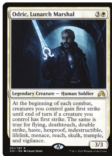
Figura 19 – Odric, Lunarch Marshal, Magic: the Gathering (Wizards of the Coast, 1993)

frente, ou no livro de regras. O texto de lembrete pode ser visto como redundante, no entanto este possui a função de ensinar o que estas keywords significam em cartas com menos texto de habilidade, pois estas conseguem ceder algum espaço para a explicação do seu funcionamento. Deste modo, é então possível deixar estas explicações de parte em cartas mais complexas ou raras, como no caso de Odric, Lunarch Marshal (Figura 19), o qual concede uma série de keyworded abilities às criaturas do seu controlador. Habilidades estas que enchem a caixa de texto de habilidade da carta ao serem listadas, não deixando assim espaço para a texto de lembrete, dando assim exemplo de como as keyworded abilities podem ser utilizadas e do espaço de design que estas providenciam.