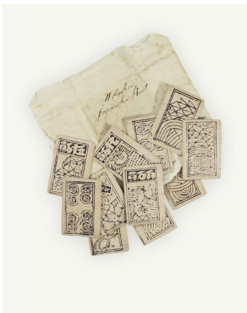
Figura 8 – Tipo de cartas utilizadas para jogar Madioa

Peças de Jogo: O Madioa é jogado por 4 jogadores com um baralho de 38 ou 40 dependendo da versão, sendo estas cartas de um conjunto específico de cartas chinesas (Figura 8). Similarmente a baralhos europeus já analisados, apresentam quatro conjuntos de naipes que representam diversas quantias de dinheiro da época em quantidades cada vez maiores, dividindo-se em Cash , Strings (de Cash ), Myriads (de Strings de Cash ), e Tens (de Myriads de Strings de Cash ).