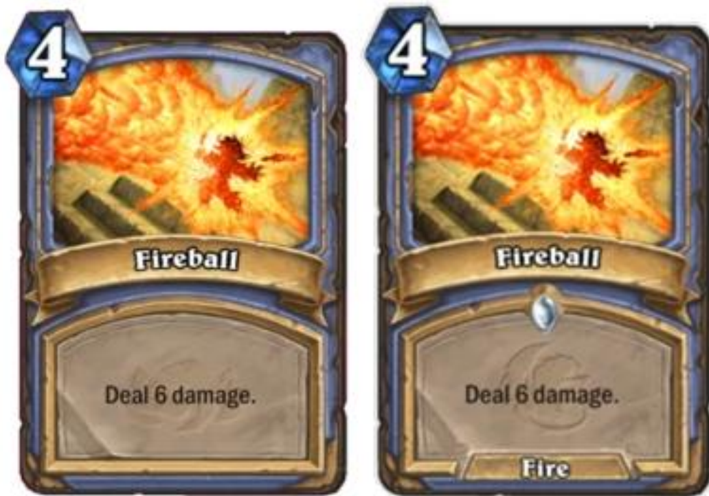
Figura 28 – (Esquerda) Fireball no seu estado original, (Direita) Fireball com o tipo de Fire (parte inferior da carta), Hearthstone (Blizzard Entertainment, 2014)