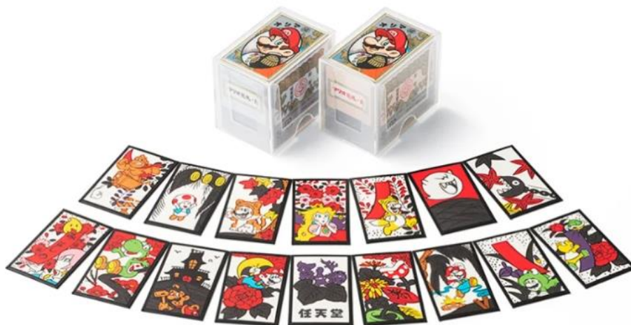
Figura 9 – Cartas de Hanafuda com a temática de Super Mario, (Nintendo, 2020)

década de 1970, mas continua a produzir cartas no Japão, incluindo conjuntos temáticos baseados em Mario, Pokémon e Kirby (Figura 9).