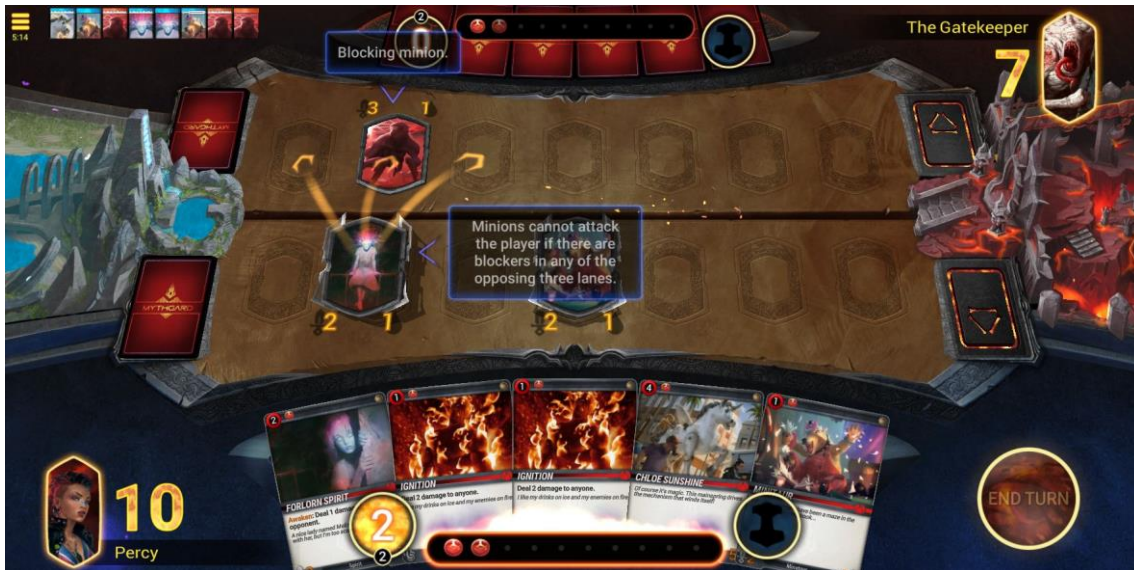
Figura 26 – Campo de jogo de Mythgard (Rhino Games, inc., 2020)