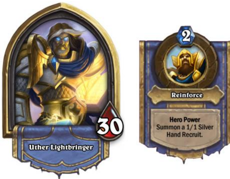
Figura 23 – Hero Class de Paladin e o seu Hero Power, Hearthstone (Blizzard Entertainment, 2014)