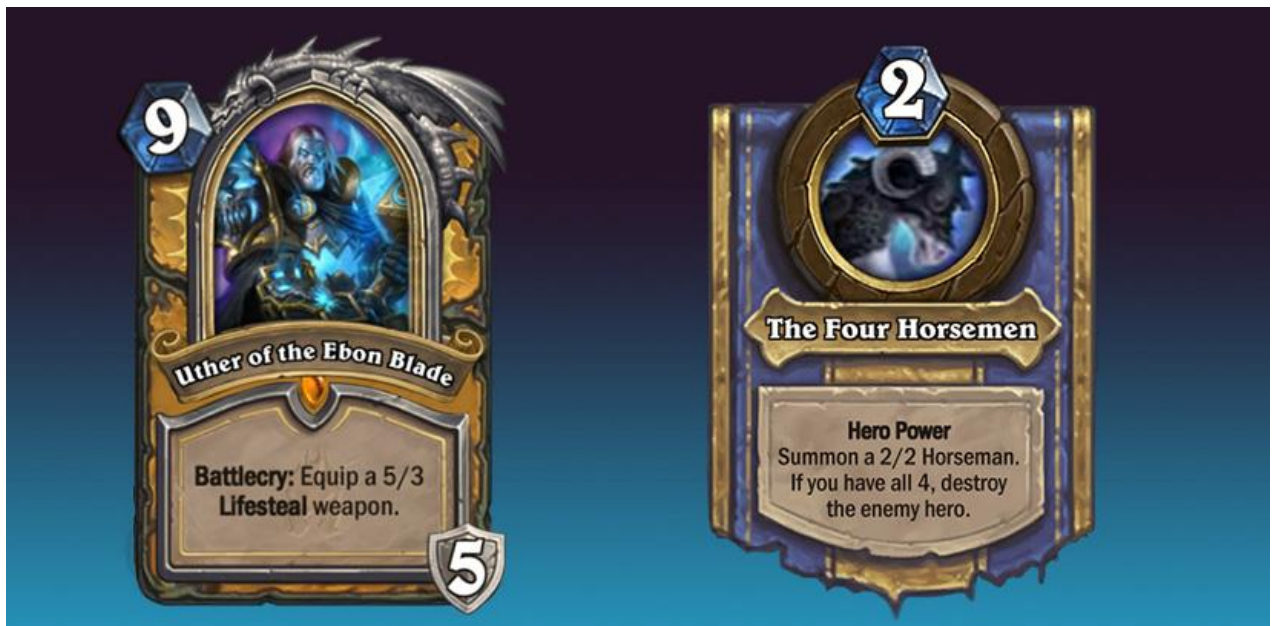
Figura 22 – Uther of the Ebon Blade e o seu Hero Power, Hearthstone (2014)