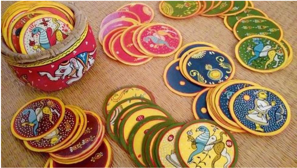
Figura 5 – Cartas de Ganjifa