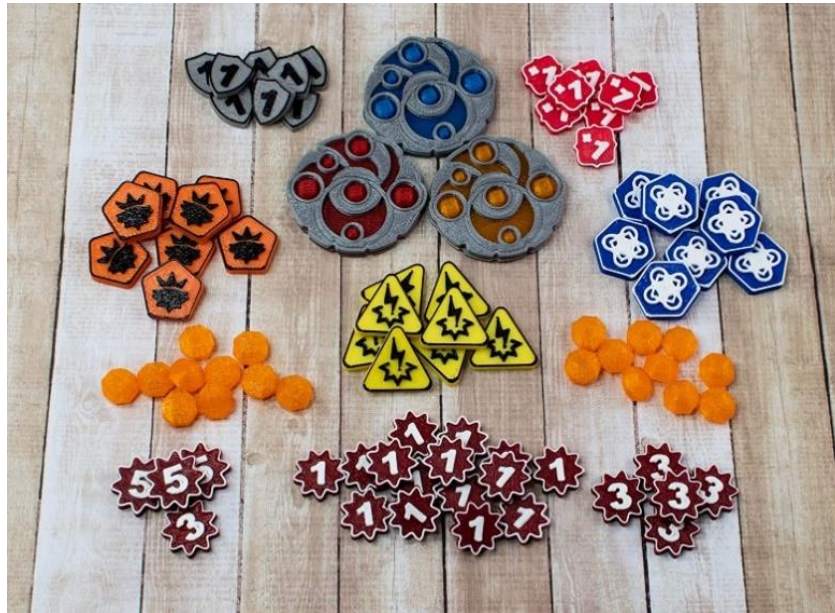
Figura 16 – Marcadores de jogo de Keyforge (Fantasy Flight Games, 2018)