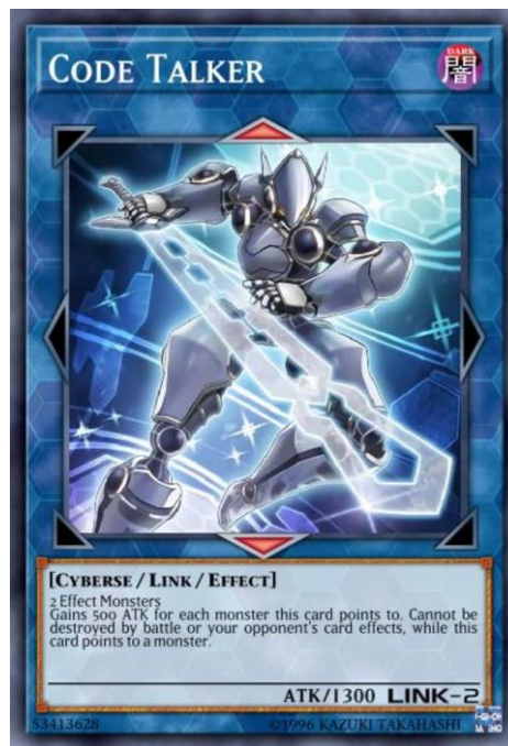
Figura 25 – Code Talker, Yu-Gi-Oh! (Konami, 1999)

Representativas. No Magic: the Gathering podemos observar os componentes básicos de um Campo de Jogo, pois este divide as áreas em três parcelas distintas, o battlefield onde colocam cartas permanentes, como Cartas de Unidade ou de Recurso, a library que se refere à zona onde o baralho se encontra e o graveyard que funciona como uma zona de descarte onde se colocam as cartas não permanentes após o seu uso ou cartas permanentes que para lá sejam enviadas devido a regras de jogo. Adicionalmente, em jogos de commander existe a command zone onde se coloca a Carta de Identidade do jogador. Apesar de bem definido, este Campo e Jogo não especifica onde o deve colocar fisicamente os objetos de jogo, podendo o jogador colocar a sua library em qualquer canto da sua área de jogo.