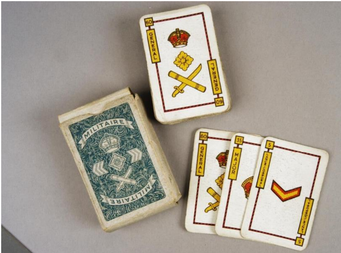
Figura 11 – Cartas de um baralho de Militaire

Peças de Jogo: Para se jogar uma partida de Militaire são necessários entre 3 a 4 jogadores. Um baralho das seguintes 54 cartas são necessárias para se jogar uma partida de Militaire: 7 cartas de “No.5 Lance-Corporal”, 7 cartas de “No.10 Corporal”, 7 cartas de “No.15 Sergeant”, 4 cartas de “No. 20 2nd Lieutenant cards”, 4 cartas de “No.25 Lieutenant”, 4 cartas de “No.30 Captain”, 4 cartas de “No.35 Major”, 4 cartas de “No.40 Lieutenant-Colonel”, 4 cartas de “No.45 Colonel”, 4 cartas de “No.50 Brigadier”, 4 cartas de “No.60 General”, e 1 carta de “Sergeant-Major 'Master'”.