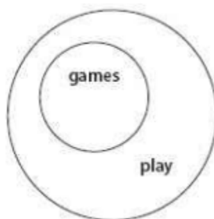
Figura 1 – Gráfico que demonstra o “jogar” como um subconjunto de “brincar”, Salen, K., et Zimmerman, E. (2003)

Se pensarmos em todas as atividades que poderíamos chamar de brincadeiras, desde dois cães a se perseguirem divertidamente um outro num campo, a uma criança a cantar uma poesia infantil, a uma comunidade de role-players online , parece que apenas algumas dessas formas de brincar constituiria realmente o que poderíamos considerar como um jogo. Jogar Dodge Ball , por exemplo, é jogar um jogo: os jogadores obedecem a um conjunto formalizado de regras e competem para vencer. As atividades de brincar num baloiço, ou brincar num Jungle Gym entretanto, são formas de brincadeira que não constituem um jogo. A maioria das formas de brincar são mais soltas e menos organizadas do que os jogos. No entanto, algumas formas de brincar são formalizadas, e essas formas de brincar podem muitas vezes ser consideradas jogos. Nesse sentido, fica claro que “jogar” é um subconjunto de “brincar”. Trata-se de uma abordagem tipológica, que define a relação entre brincar e jogar de acordo com as formas que assumem no mundo, como podemos ver na (Figura 1).