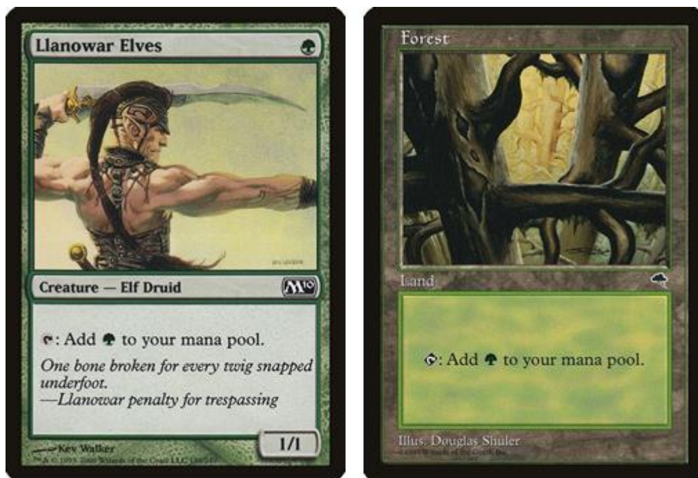
Figura 24 – (Esquerda) Llanowar Elves, (Direita) Forest – Basic Land, Magic: the Gathering, (Wizards of the Coast, 1993)

de Magic the Gathering, ou os Mana Crystals de Hearthstone que, tal como os Heróis já referidos, não são apresentados visualmente como cartas apesar de preencherem o mesmo papel. Existem ainda cartas que podem produzir estes recursos, mas que podem não ser consideradas cartas de Recurso, como por exemplo Llanowar Elves (Figura 24) de Magic: the Gathering, que apesar de poder produzir recursos de forma similar a um Terreno Básico, é primariamente uma carta de Unidade. Similarmente, jogos como Shadow Era, não têm um tipo de carta especificamente desenvolvido para recursos, optando ao invés por deixar o jogador colocar qualquer carta da sua mão na Zona de Recursos virada para baixo, passando a tratar essas cartas como cartas de Recurso, similares a Mana de Hearthstone e Terrenos de Magic: the Gathering. Outros jogos como Pokémon Trading Card Game, não têm uma zona de recursos à parte, neste caso os jogadores colocam as suas cartas de recursos, denominadas de Energy no Pokémon Trading Card Game, diretamente nas cartas de Unidade de modo similar a cartas de Acessório.