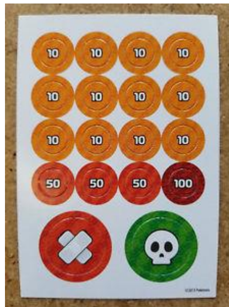
Figura 17 – Marcadores de jogo de Pokémon Trading Card Game (The Pokémon Company, 1996)