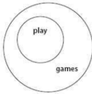
Figura 2 – Gráfico que demonstra o “brincar” como um subconjunto de “jogar”, Salen, K., et Zimmerman, E. (2003)