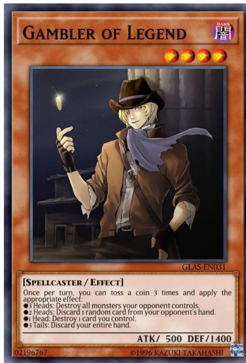
Figura 31 – Gambler of Legend, Yu-Gi-Oh! (Konami, 1999)