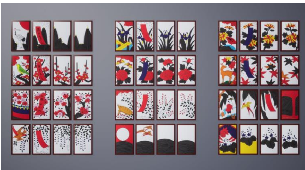
Figura 10 – Baralho Completo de Hanafuda

Peças de Jogo: Dois jogadores e um baralho de 40 cartas de Hanafuda (Figura 10), estas cartas são ilustradas com representações de plantas, pequenos bilhetes traicionais japoneses denominados de tanzaku, animais, pássaros, objetos humanos, e uma única carta que representa um humano. O verso geralmente é liso, sem padrão ou desenho de qualquer tipo. Os temas são tão fortes que para um outsider pode ser difícil perceber o que se está a passar.