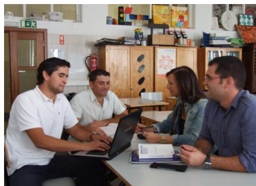
Fig. 3-Grupo de estágio A.

Como demonstra a figura 6, o grupo de estágio A é constituído por três alunos do segundo ano do Mestrado em Ensino das Artes