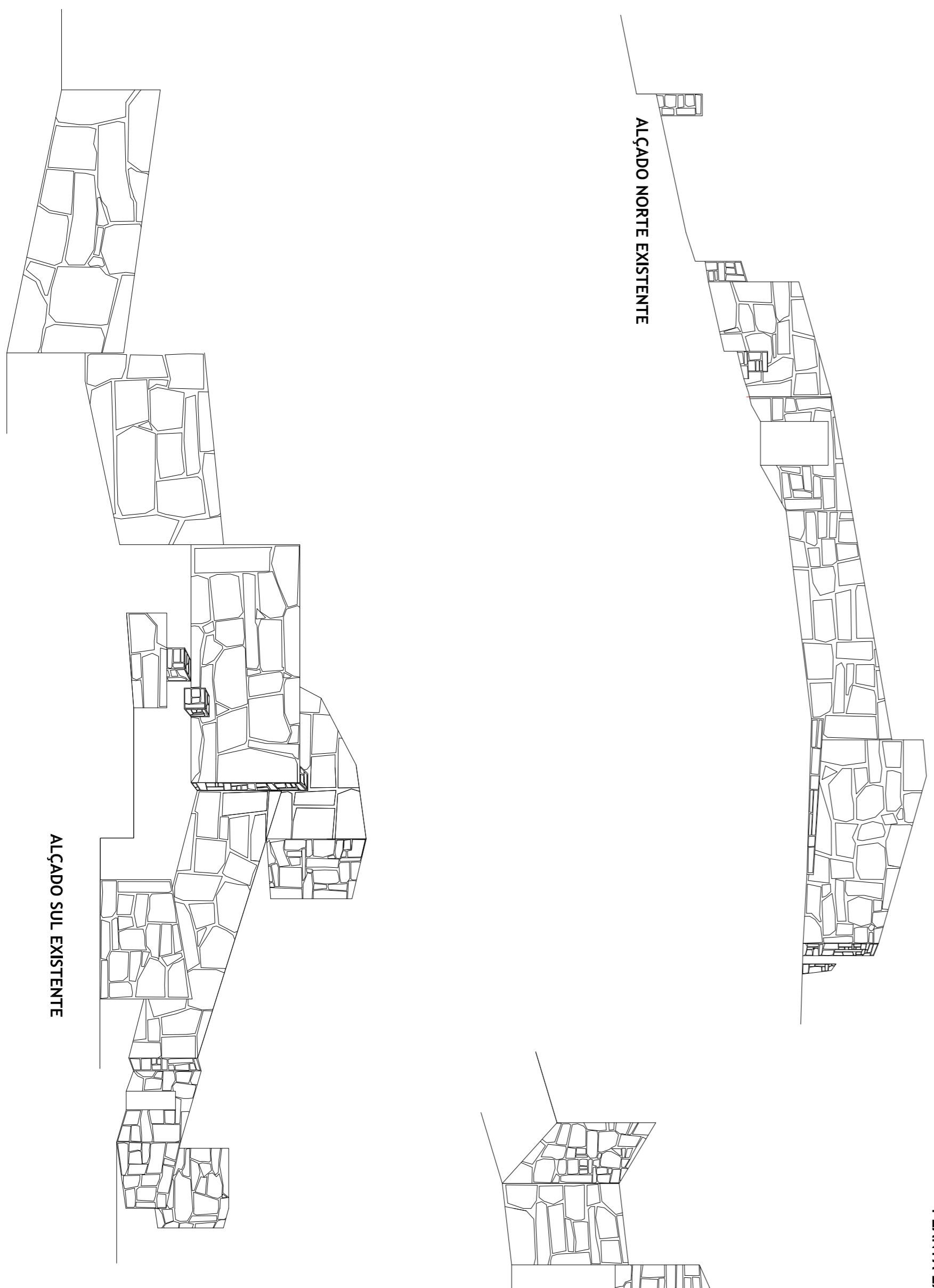
ALÇADO NORTE EXISTENTE