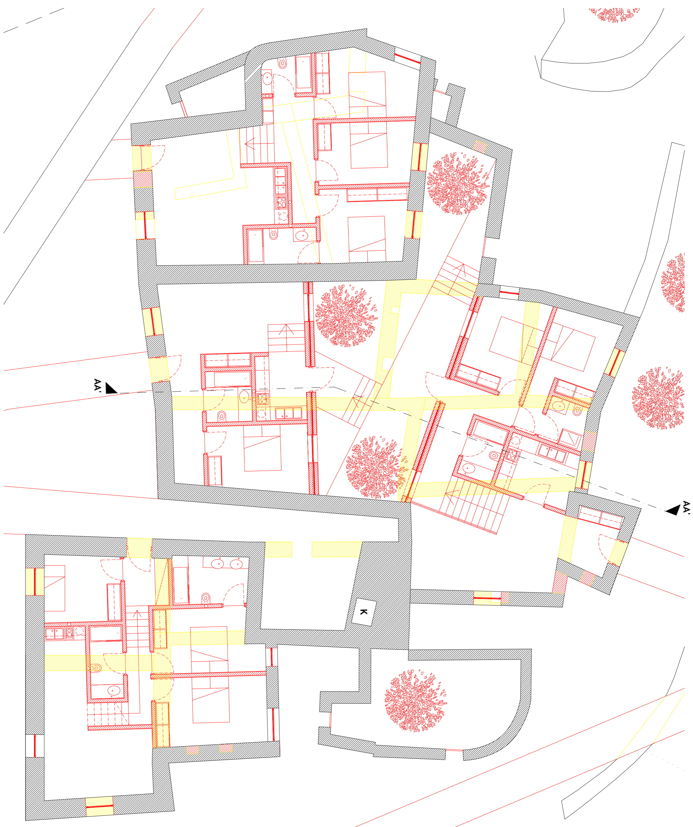
PLANTA DE SOBREPOSIÇÃO