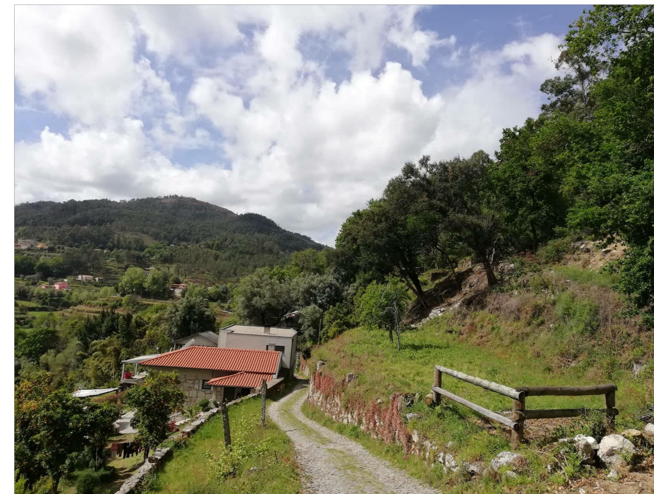
Local de intervenção