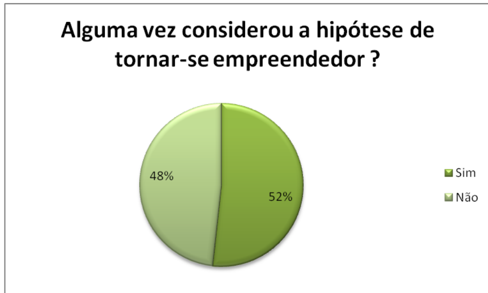
Figura 3 - Alguma vez considerou a hipótese de considerar-se empreendedor