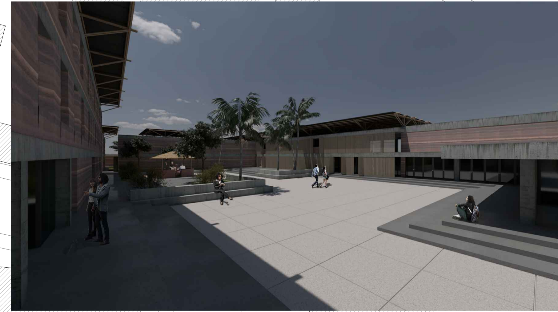
VISTA DO PÁTIO CENTRAL