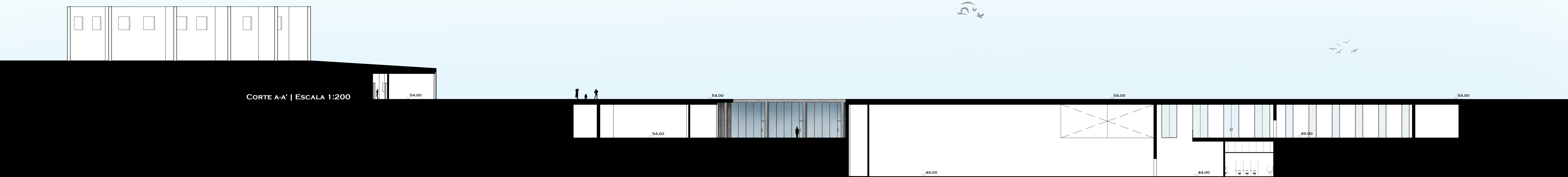
CORTE A-A' | ESCALA 1:200