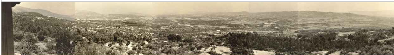
Fotografias do terreno 1965