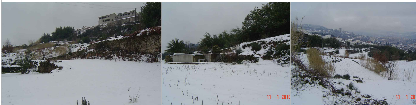
Fotografias do terreno 2010 - Neve