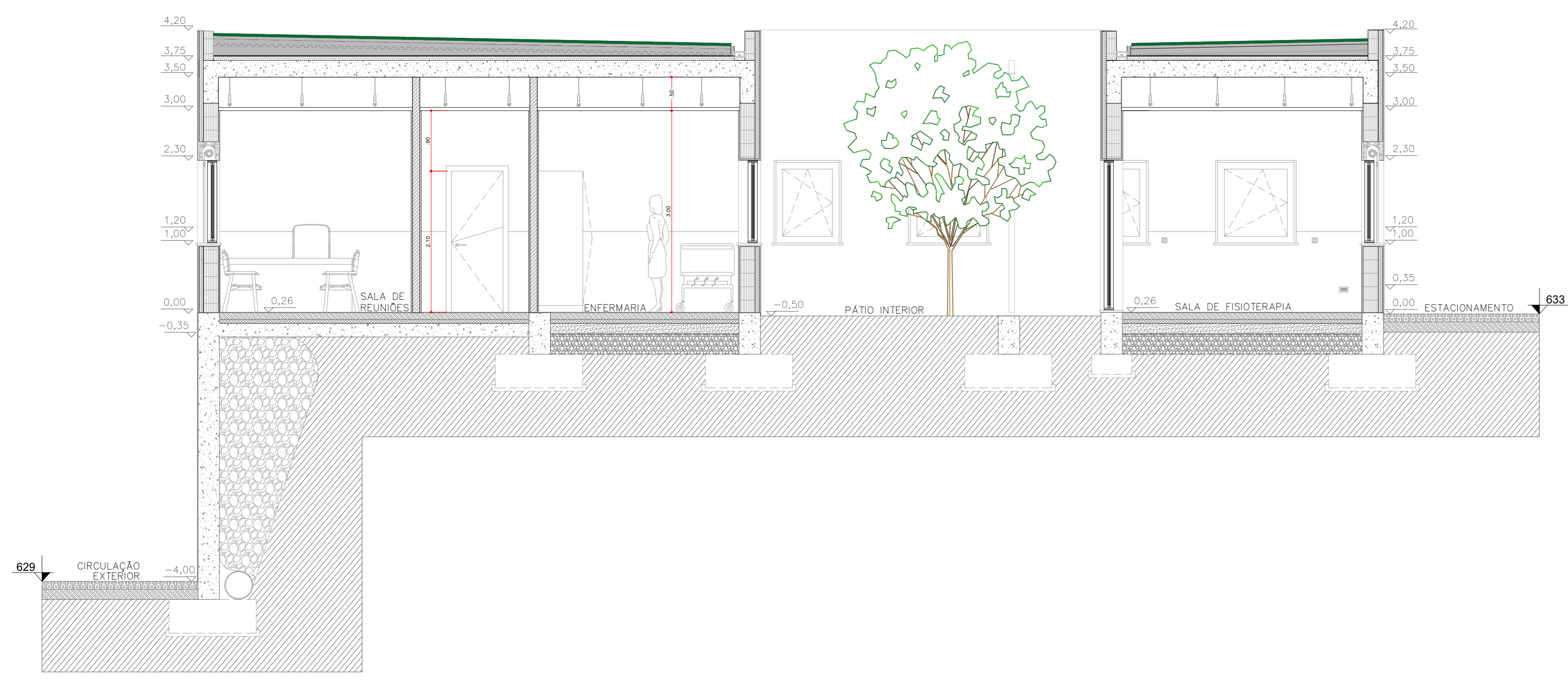
CORTE E.E. 629