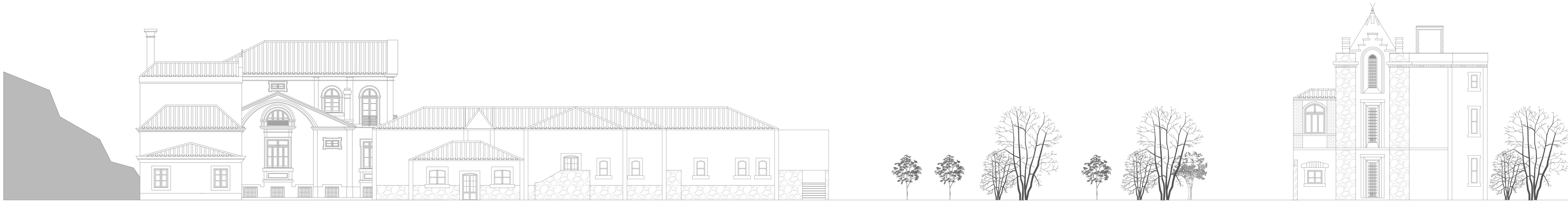
Alçado Nascente , 1:100