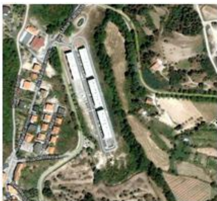
Figura 1 - Vista aérea do Bairro das Nogueiras

Os territórios onde será criada a Incubadora Juvenil são o Bairro de Habitação Social das Nogueiras (figura 1), no Teixoso, onde residem 160 famílias e o Bairro de Habitação Social da Alâmpada (figura 2), na Boidobra, onde residem 192 famílias.