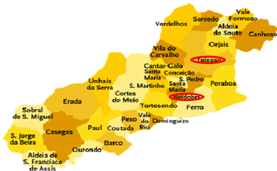
Figura 3 - Localização das Freguesias de Boidobra e Teixoso, no concelho da Covilhã

Como são dois bairros com realidades diferentes entre si, como já referido anteriormente, e também distantes geograficamente, optou-se por trabalhar com cada um deles de forma independente, de forma a atingir os objetivos do projeto com maior eficácia. Não obstante receber outros jovens residentes noutras freguesias do concelho da Covilhã, a incubadora estará situada nestes dois bairros, sendo por isso esperado que, pelo menos numa primeira fase, seja mais frequentada pelos jovens destes bairros. Concretamente a incubadora ficará sediada em dois locais, que neste momento estão cedidos à Beira Serra e a ser utilizados pelo projeto Arca de Talentos.