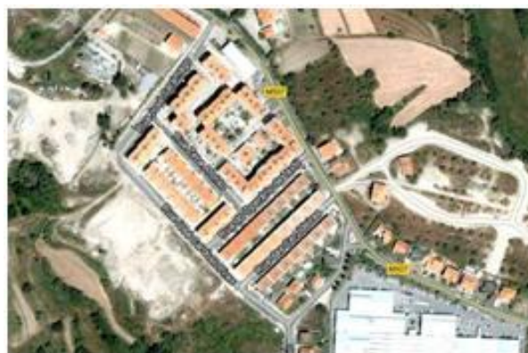
Figura 2 - Vista aérea do Bairro da Alâmpada

Os dois bairros estão distanciados geograficamente, como podemos analisar pela figura 3, o Bairro da Alâmpada está situado na Freguesia de Boidobra e o Bairro das Nogueiras, na Freguesia do Teixoso, ambas as freguesias pertencentes ao concelho da Covilhã, distrito de Castelo Branco.