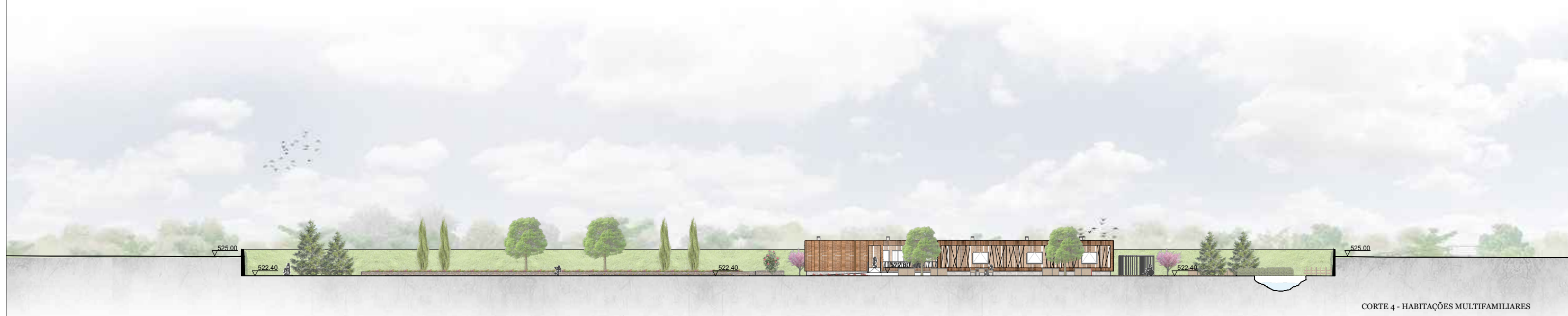
CORTE 4 - HABITAÇÕES MULTIFAMILIARES