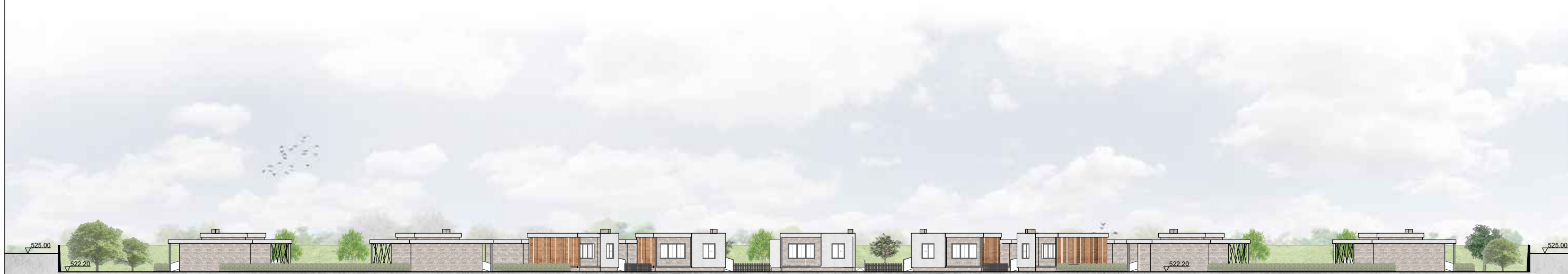
CORTE 2 - HABITAÇÕES UNIFAMILIARES