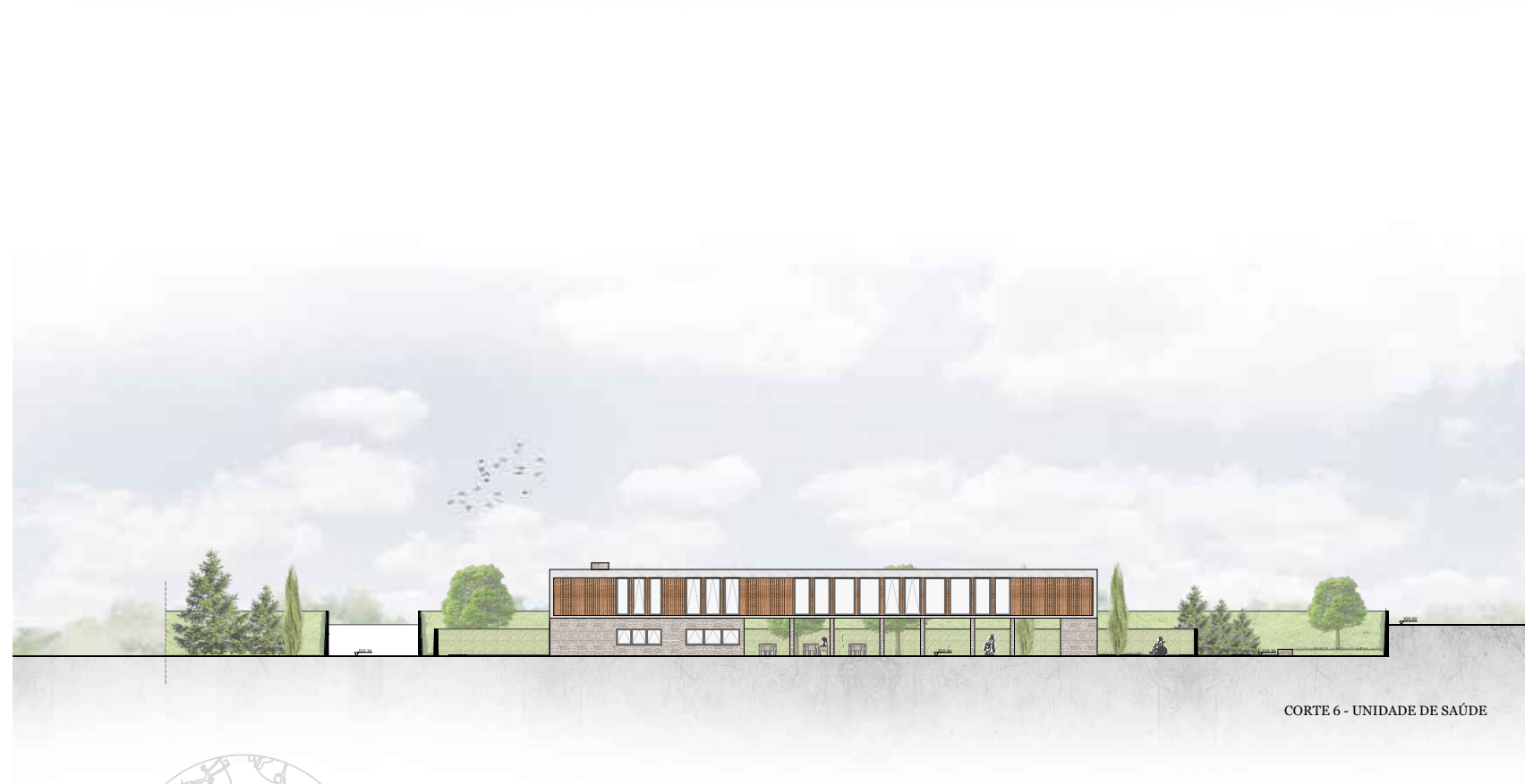
CORTE 6 - UNIDADE DE SAÚDE