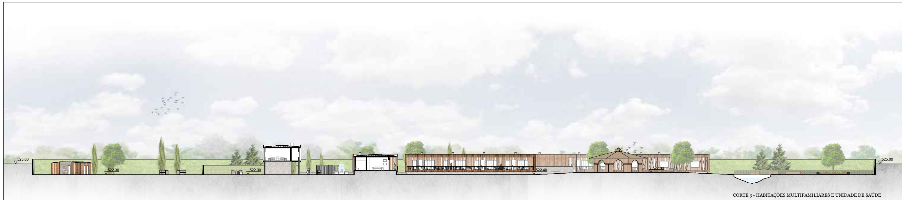
CORTE 3 - HABITAÇÕES MULTIFAMILIARES E UNIDADE DE SAÚDE