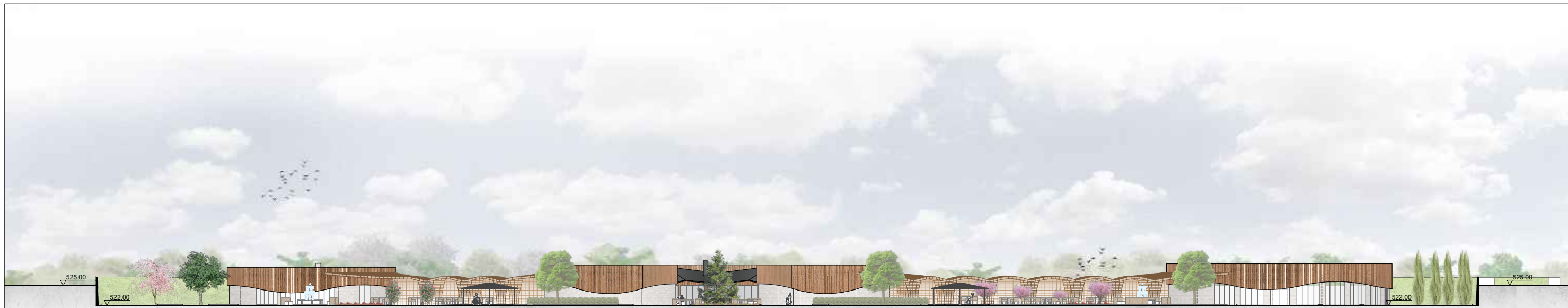
CORTE 1 - ZONA PÚBLICA