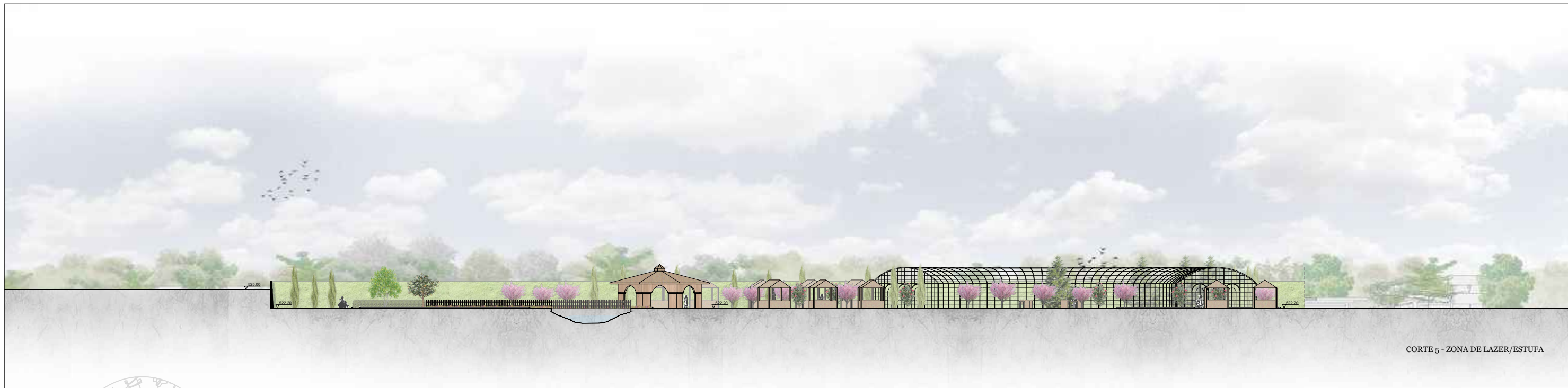
CORTE 5 - ZONA DE LAZER/ESTUFA