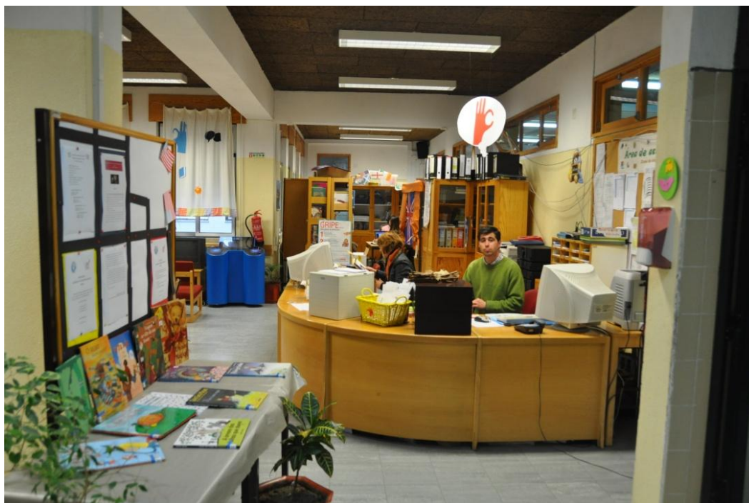
Fotografia 2- Zona de Pesquisa e computadores com acesso à Internet.