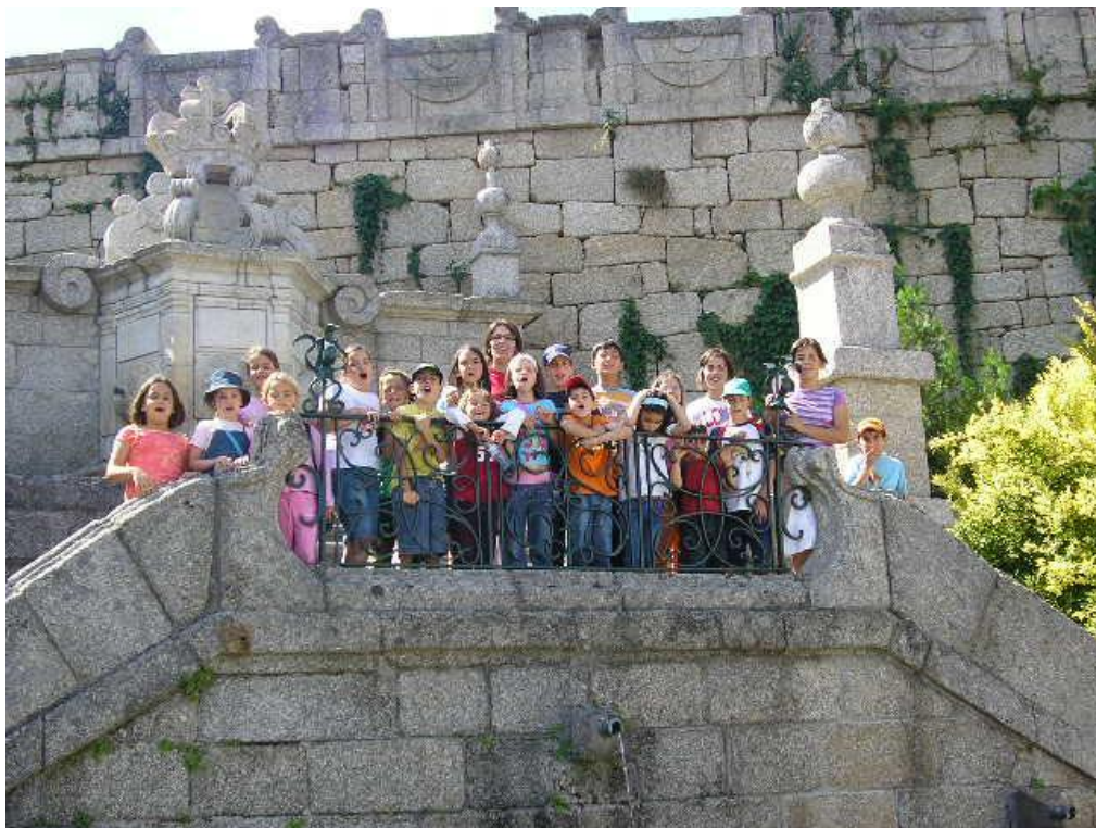
Fotografia 10 - Actividades de expressão plástica.