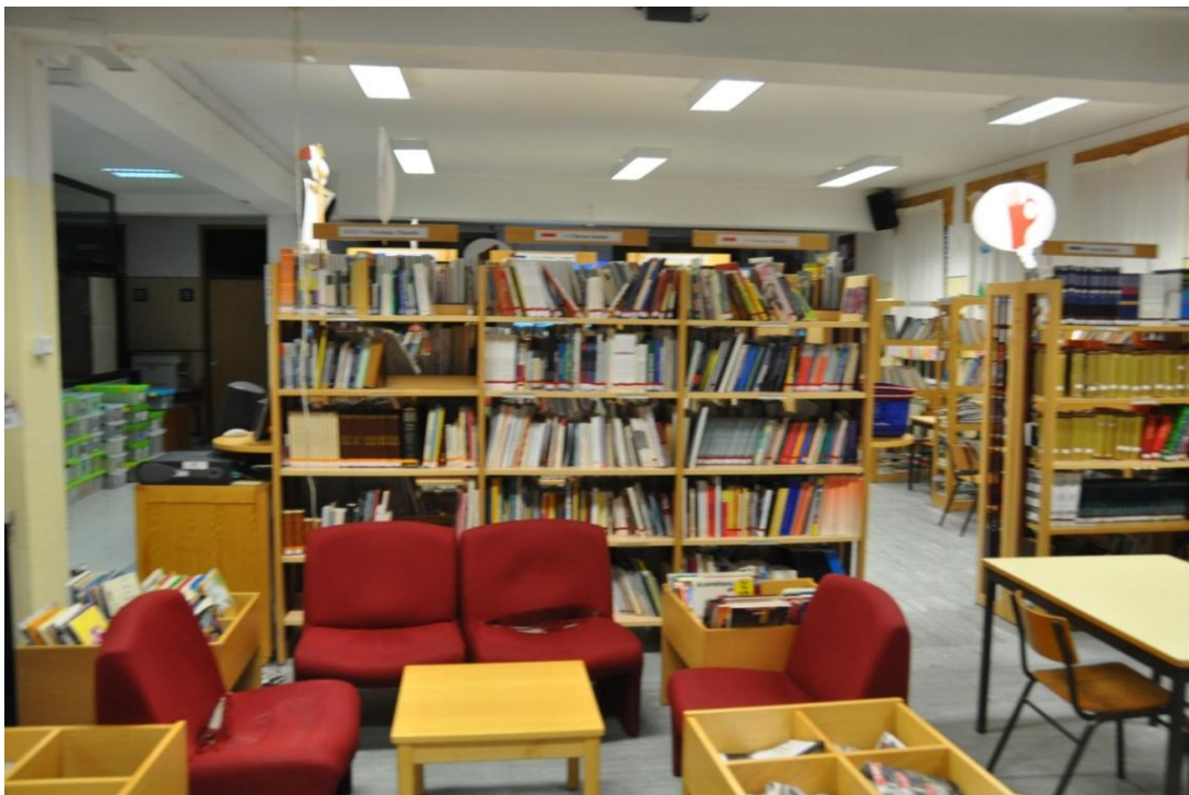
Fotografia 4- Baús com conjunto de obras recomendadas pelo PNL.