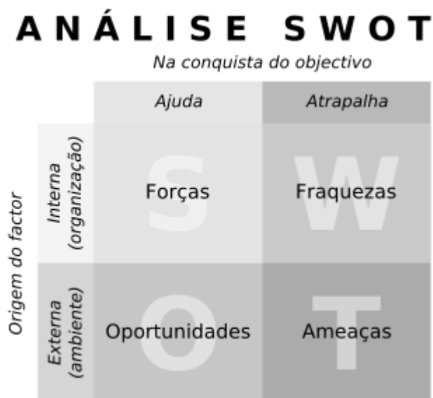
Figura 2 - Apresentação do esquema da análise SWOT

Seguidamente, apresentamos a análise da BECRE da Serra da Gardunha, utilizando o modelo SWOT (Forças, Fraquezas, Oportunidades e Ameaças), referente aos dois últimos anos lectivos: