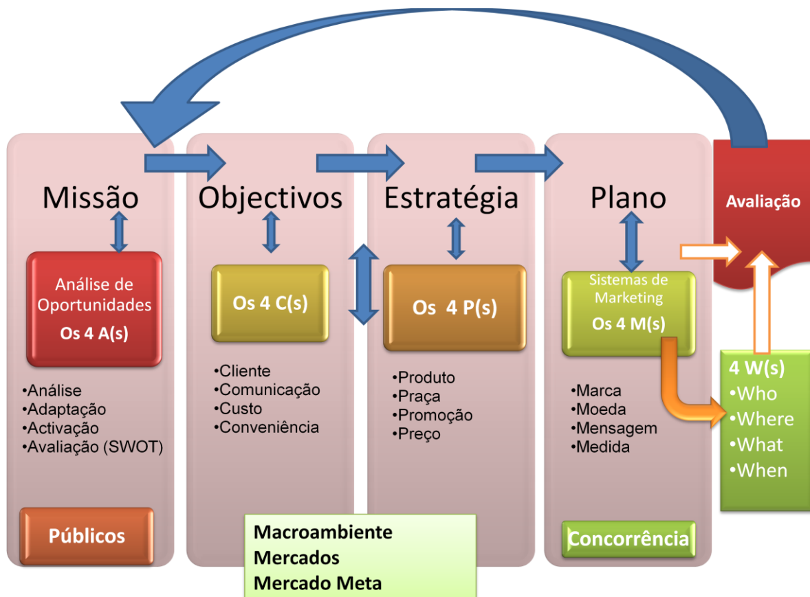
Figura 4 - Esquema de Planificação Estratégica