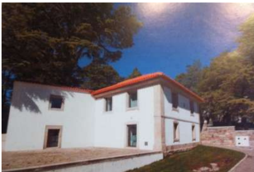
Figura 1- Edifício do Centro de Estudos Ibéricos

Primeiramente, este Centro teve a sua sede, embora provisória, no interior da Câmara Municipal da Guarda. Mais tarde, em 2002, a CMG, após um demorado processo de contencioso, consegue adquirir para usufruto público o edifício Quinta do Alarcão, destinado a ser a futura sede do CEI. Após as obras de remodelação, o CEI é inaugurado neste edifício em 2005, no entanto, por questões logísticas, só entra em funcionamento em 2009, aquando da inauguração da Biblioteca Municipal Eduardo Lourenço (BMEL), localizada junto do CEI. (CEI, 2010:9-10)