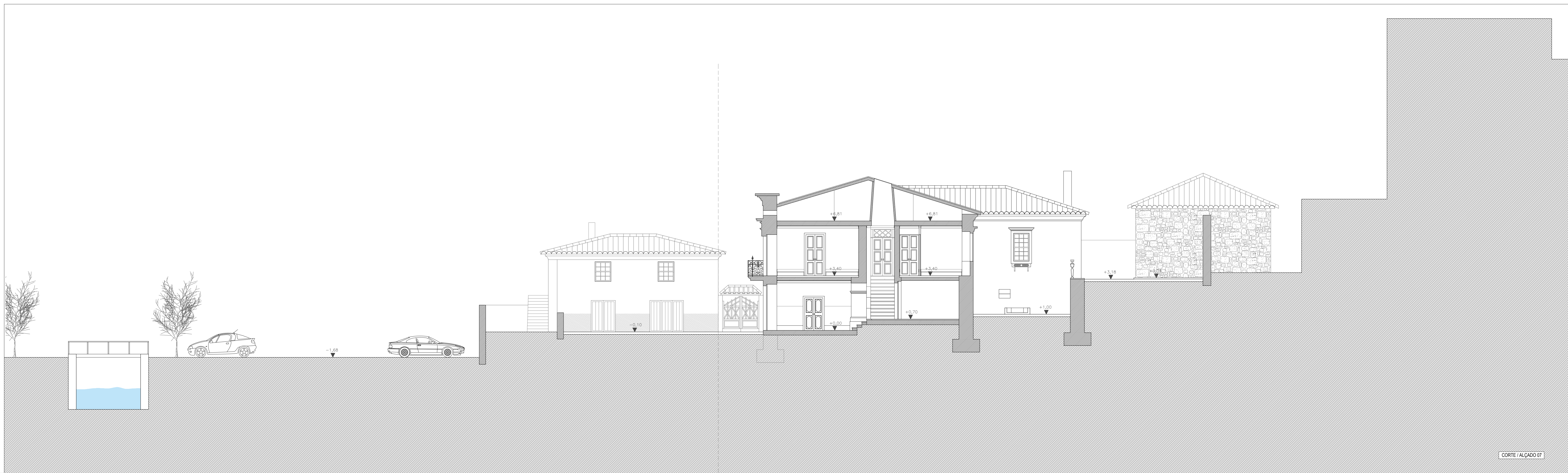
CORTE ALÇADO 07