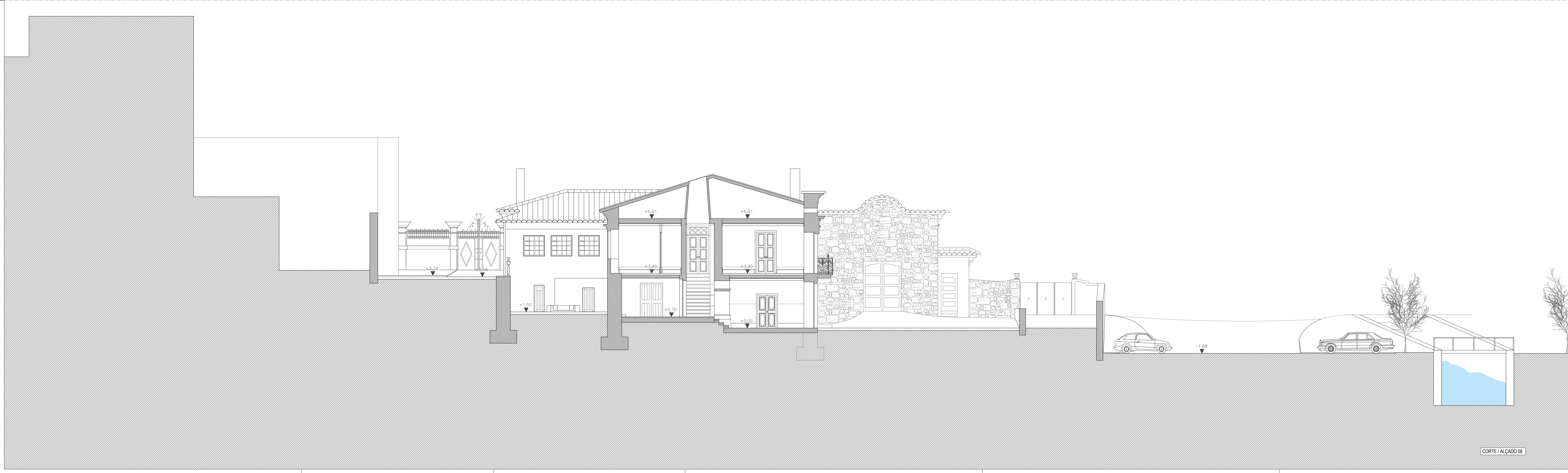
CORTE ALÇADO 08